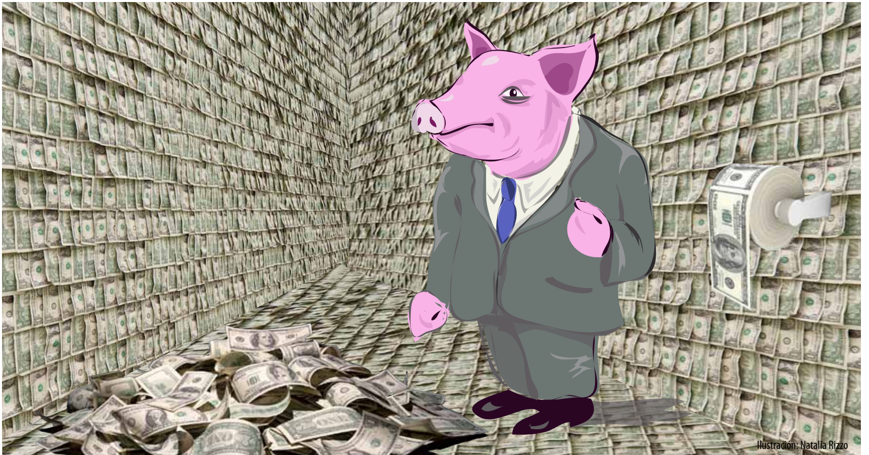
Ilustración: Natalia Rizzo