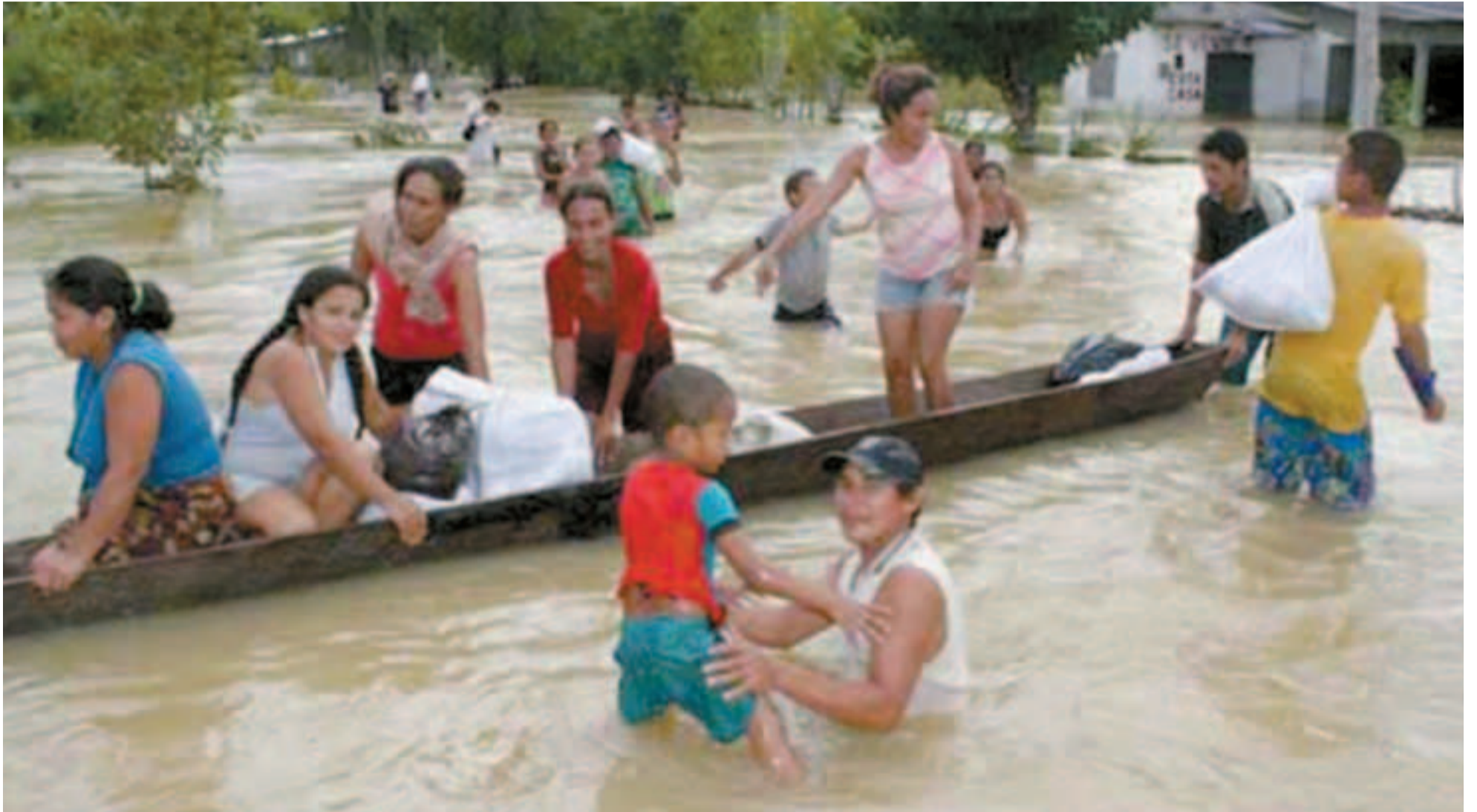
Con el agua hasta el cuello por la ineptitud gubernamental.