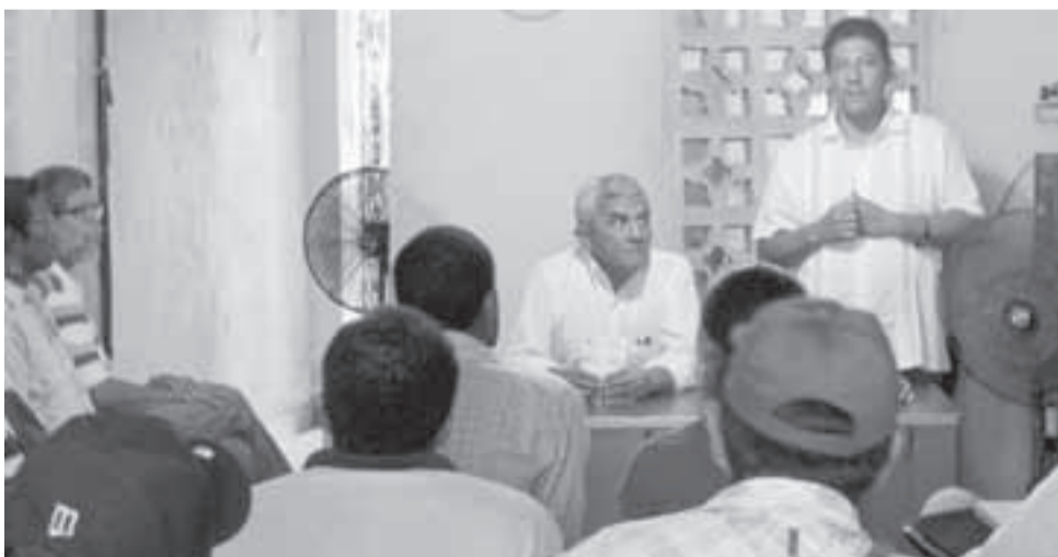
El representante indígena en reunión con dirigentes políticos y populares en Cartagena de Indias.