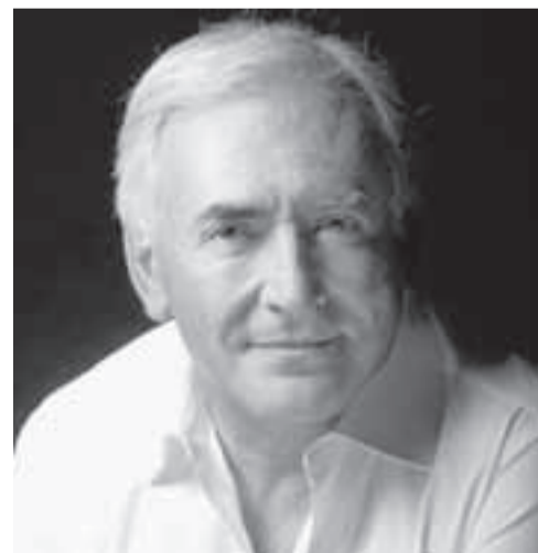
Dominique Strauss-Khan, presidente del FMI

E l escándalo en el mundo de las finanzas, por los desafueros sexuales del presidente del FMI, denota la corrupción en las altas esferas del poder capitalista. Al conocerse la noticia, desde París la periodista Tristane Banon anunció que presentará cargos por abuso sexual contra Strauss-Khan. En realidad la detención del financista se produjo por otros cargos similares, presentados por una antigua asistente suya. Más tarde, antes de que alcanzara, mediante pago de una caución, conseguir arresto domiciliario, se conocieron otras acusaciones y el hombre deberá responder al menos por siete cargos de naturaleza similar.