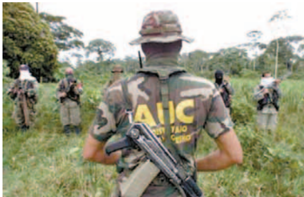
Las "AUC" impusieron el poder local en los últimos 15 años en la región Caribe, colocando allí a sus candidatos y colaboradores.

Córdoba, como laboratorio paramilitar, irradió al resto de la región Caribe donde ancó el paramilitarismo, estimulado por la complicidad de autoridades civiles y militares, empresarios, en particular ganaderos y latifundistas, narcotraficantes, transnacionales y políticos tradicionales. Un entramado criminal que aún persiste