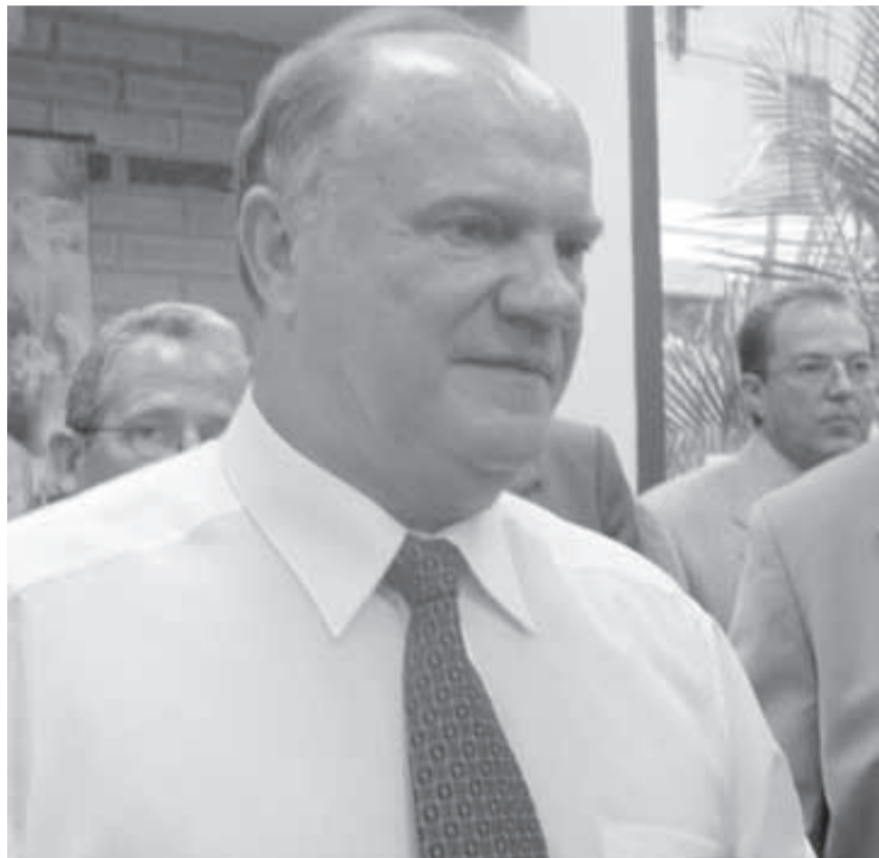
Guennadi Ziugánov, dirigente del Partido Comunista de la Federación Rusa.