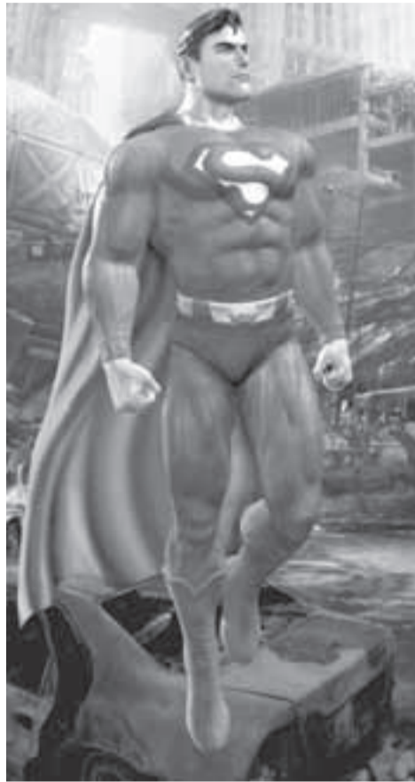
Supermán, el hombre de acero