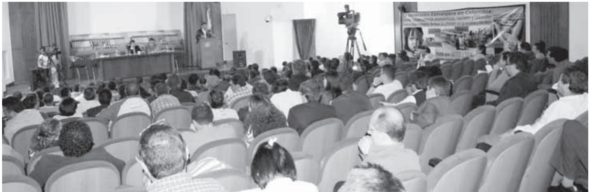
Durante varias horas los representantes de instituciones y organizaciones de trabajadores, intercambiaron conceptos acerca del papel de las multinacionales en el país.

El país avanza hacia la reprimarización de la economía por cuenta de la entrega de los recursos naturales al capital extranjero, que ocasiona una desindustrialización y una concentración de poderes económicos con el respaldo del aparato paramilitar. El Gobierno Nacional ofrece cada vez más garantías a los foráneos en contravía de los derechos laborales, de asociación y los derechos humanos de millones de colombianos