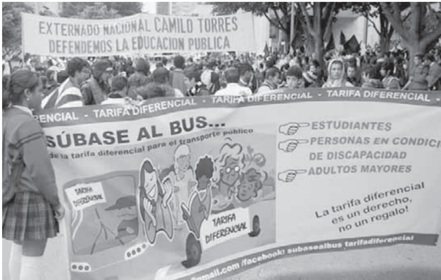
ANDES se une a la lucha por el derecho a la educación y en contra de la reforma a la Ley 30.

Del 20 al 22 de mayo del presente año, se realizó en la ciudad de Pereira el VI Congreso Nacional de Estudiantes de Secundaria, convocado por la Asociación Nacional de Estudiantes de Secundaria -ANDES-