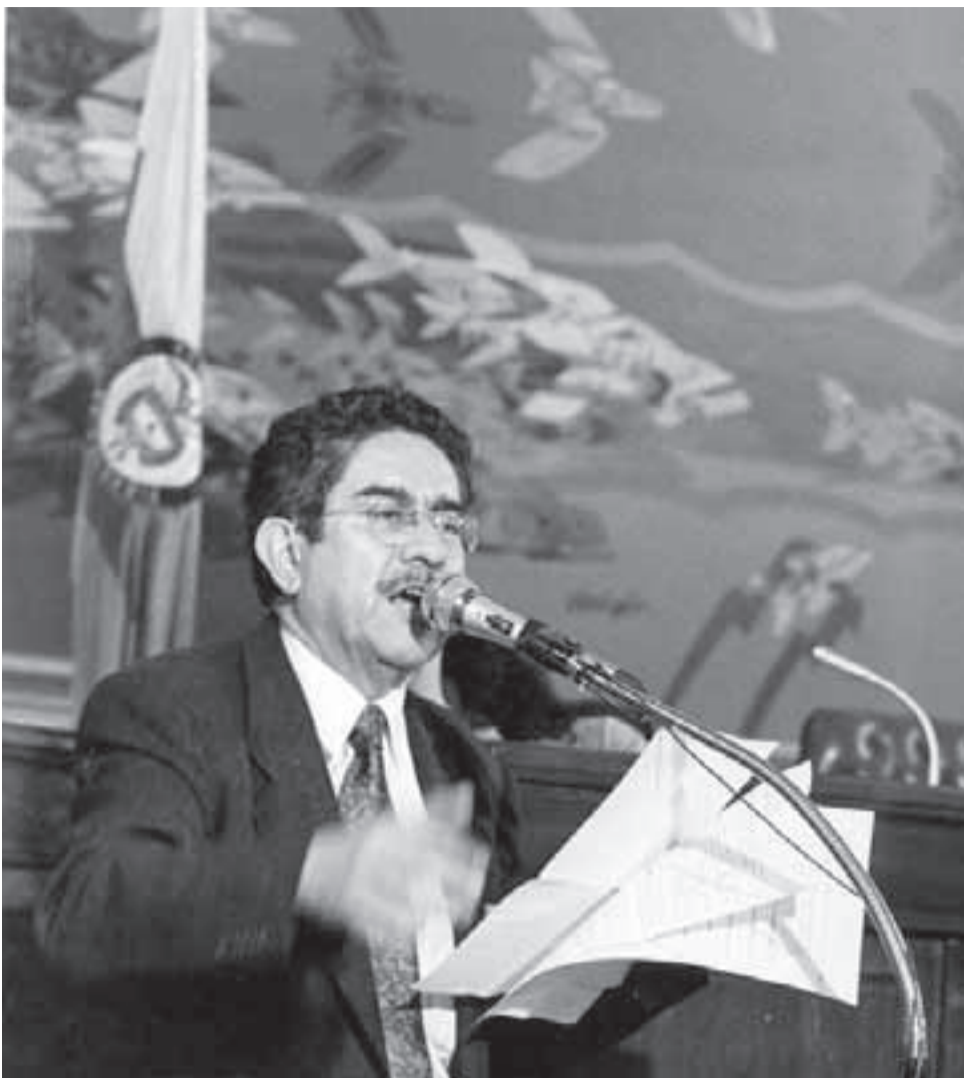
Manuel Cepeda Vargas, senador comunista y ex director de VOZ