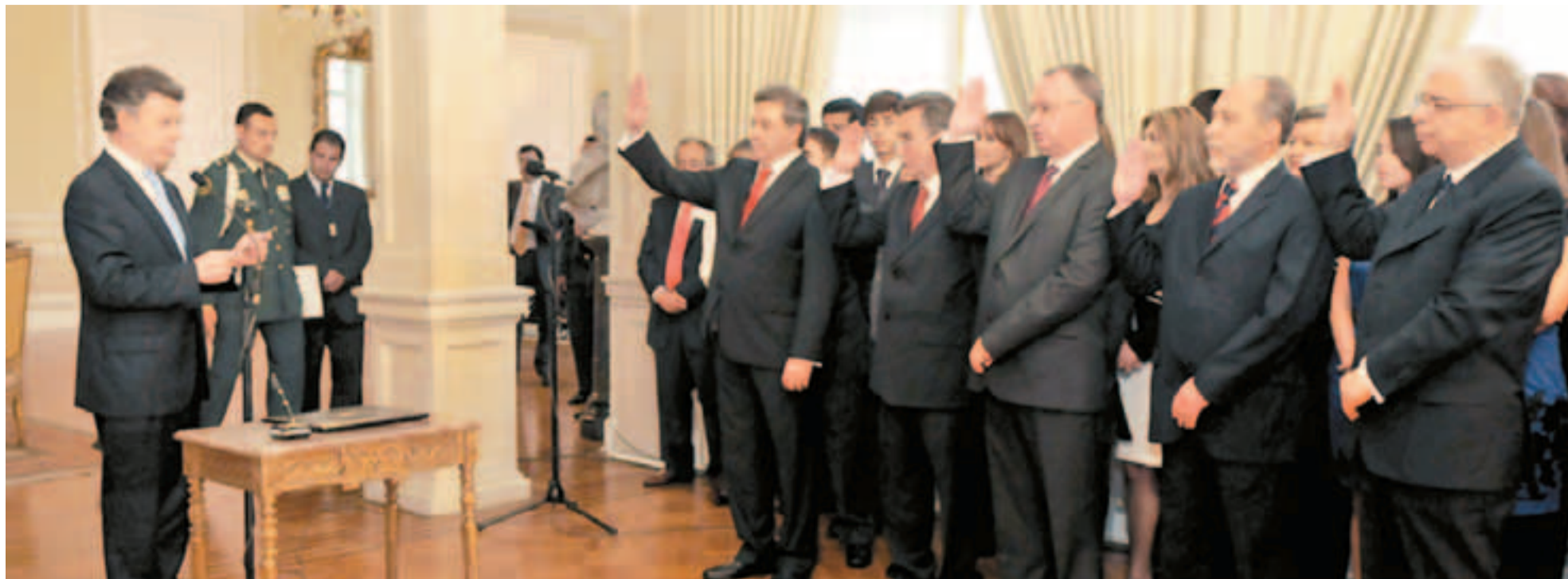
Nuevos Magistrados de la Corte Suprema de Justicia.