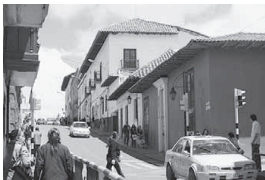
Durante varias horas la ciudad estuvo paralizada.

L a Mesa Nacional de Regalías, organización que agrupa a los habitantes de Arauca, Casanare, Meta, Santander, Cesar, Guajira, Puerto Boyacá, Putumayo, Tolima y Huila, convocaron a un paro cívico nacional para el 26 de mayo, en rechazo al robo que el Gobierno Nacional y las mayorías del Congreso pretenden hacerles.