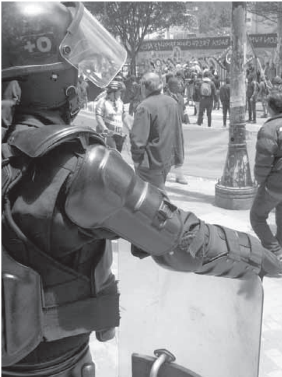
Según el informe, los responsables en un gran porcentaje de las víctimas son miembros de la Fuerza Pública.

Ya no presentan a las víctimas como miembros de grupos guerrilleros sino como personas asociadas a la delincuencia común o como errores de operación por parte de la Fuerza Pública