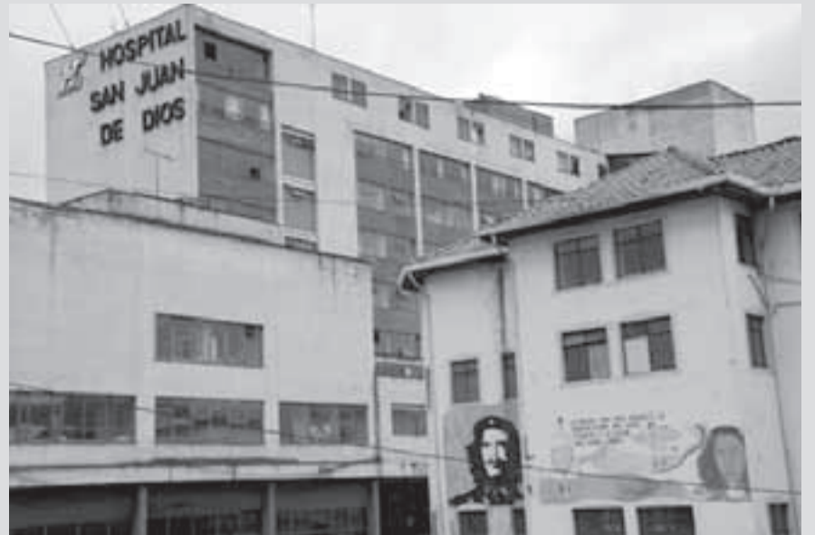
Hospital San Juan de Dios en el centro de Bogotá, que otrora fuera el centro de formación de los médicos mejor preparados del país, es hoy un parqueadero público y una institución desmantelada.

Los grados de corrupción que saltan a la luz pública, dejan ver con mediana claridad la magnitud de los actos criminales que se venían fraguando en el entremés del poder uribista, mientras el país vivía fascinado con engaños mediáticos y con la atención política puesta en peleas del ejecutivo atiborradas de cólera y persecuciones políticas a la oposición. Desde la "casa de Nari" orquestaban conciertos para delinquir y asociaciones criminales. ★