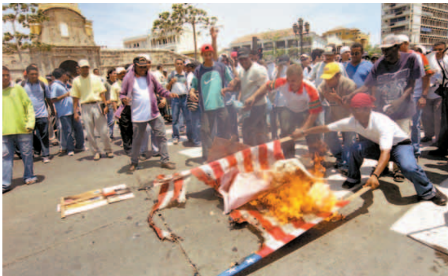
En Cartagena se han realizado numerosas movilizaciones contra el TLC.