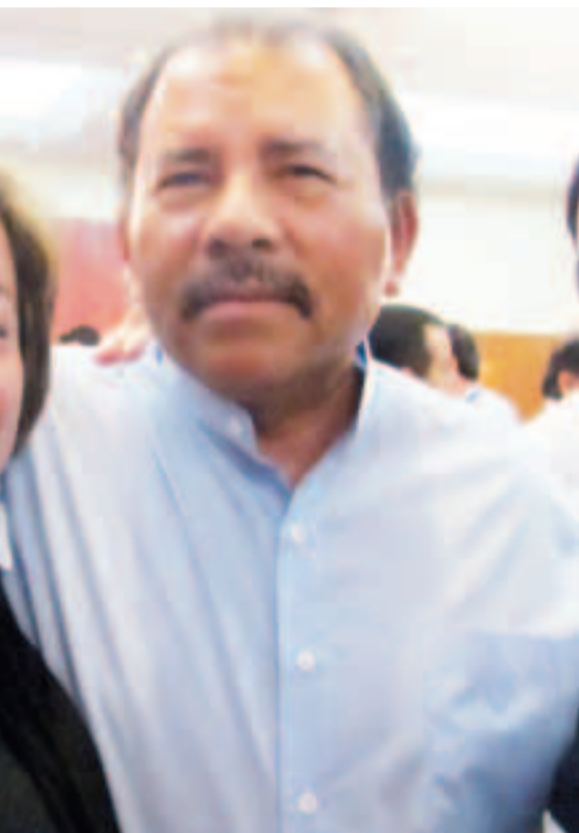
idente de Nicaragua

El Foro de Sao Paulo reafirma su apoyo al Frente Nacional de la Resistencia Popular de Honduras (FNRP) en su lucha de resistencia contra el Gobierno actual que no es sino una prolongación del golpe de Estado perpetrado contra el Gobierno legítimo de José Manuel Zelaya. Acompañamos el proceso de mediación en curso para el regreso del Presidente Zelaya.