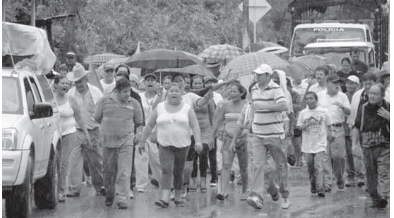
Marcha realizada por los Viotunos en contra de la trashumancia.

Los pobladores de Viotá hicieron denuncias sobre la grave situación de abandono y corrupción de la actual administración en manos de la U