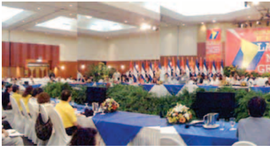
Una panorámica de la reunión