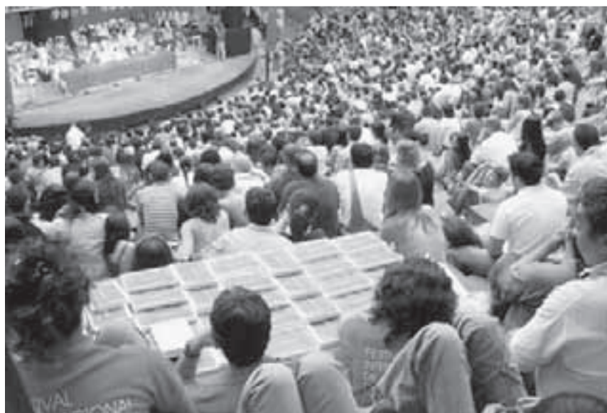
El Festival Internacional de Poesía de Medellín moviliza multitudes.

El Encuentro Mundial de Directores de Festivales Internacionales de Poesía, se ocupará de temas como Paz y reconstrucción del espíritu humano , Entrelazamiento y recuperación de la naturaleza , Unidad del espíritu humano y diversidad cultural de los pueblos , Indigencia material y riqueza espiritual y Acciones por la globalización de la poesía , y al mismo han confirmado su presencia representantes de 35 festivales internacionales de poesía: Krytia (India), Teherán (Irán), Tokio (Japón), Esmirna (Turquía), Qinghai (República Popular de China), Tel Aviv (Israel), Durban (Suráfrica), Rotterdam (Países Bajos), Struga (Macedonia), París (Francia), Granada (España), Berlín y Bremen (Alemania), Roma (Italia), Kiev (Ucrania), Oslo (Noruega), Palabra en el Mundo (Argentina/Italia), San Francisco (Estados Unidos), Trois-Rivières (Canadá), Tabasco y Veracruz (México), Santo Domingo (República Dominicana), La Habana (Cuba), Santiago de Chile (Chile), Ciudad de Panamá (Panamá), Medellín, Bogotá, Pereira y Pasto (Colombia), Quetzaltenango (Guatemala), San Juan (Puerto Rico), Valparaíso (Chile), San José (Costa Rica) y San Salvador (El Salvador).