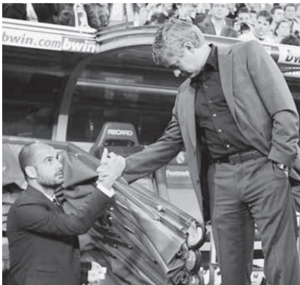
Pep Guardiola y Mourinho, directores técnicos de los equipos de fútbol españoles Barcelona y Real Madrid, respectivamente.

La falta de desarrollo de las capacidades físicas y humanas, de un pensamiento crítico en el fútbol, de garantizar infraestructura acorde a procesos de alto nivel y todas aquellas habilidades de un verdadero profesional del deporte en formación, son responsabilidad de quienes metodológica, sistemática e