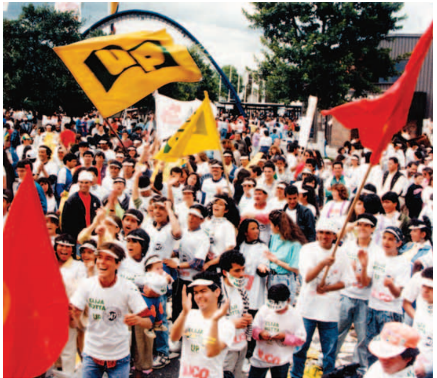
Son alrededor de cinco mil víctimas de la Unión Patriótica las que fueron excluidas en la Ley de Víctimas.

De acuerdo con la Ley aprobada y en particular su artículo tercero, en el que