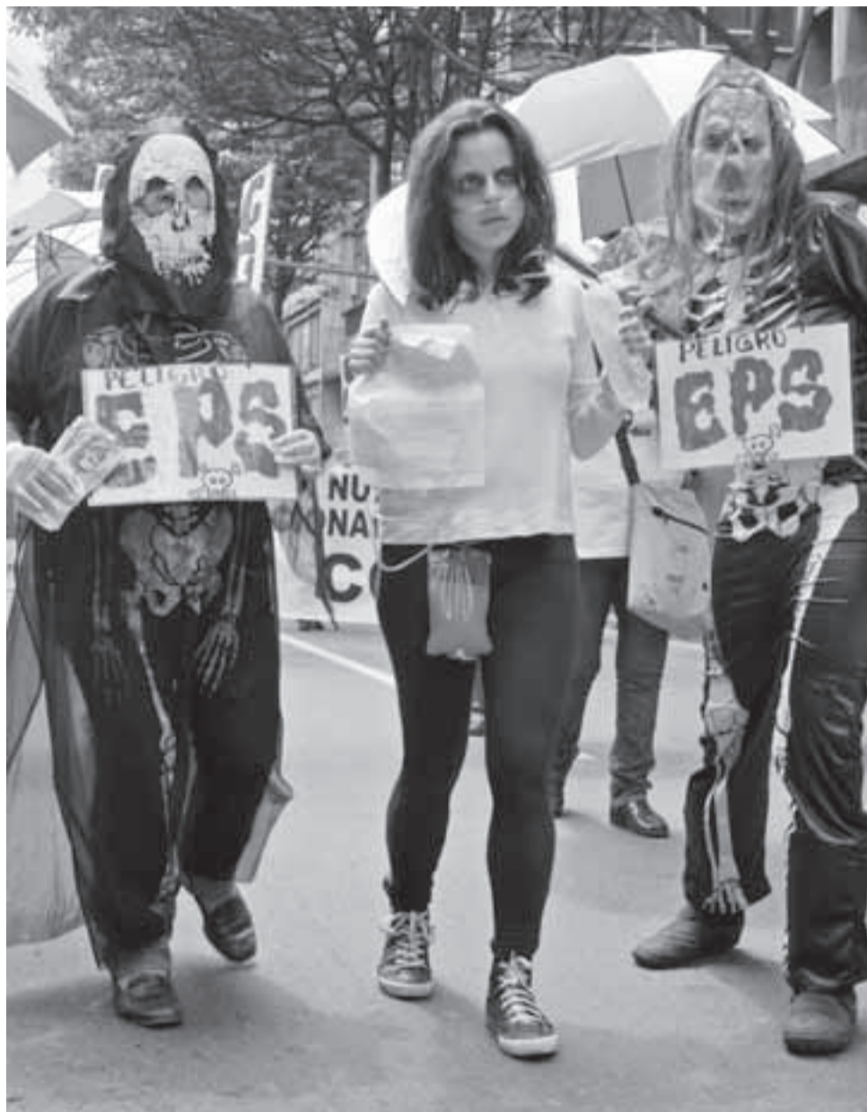
De diversas maneras en todo el país los colombianos rechazaron la intermediación permitida por la Ley 100.

“Hay que determinar un nuevo modelo de salud que se aplique a nivel universal. Es más allá de derogar la Ley 100 porque esta es solo un instrumento. Hicieron la 1122 y empeoraron el problema; la 1438 y el problema del foco de corrupción es mucho más grave y las medidas que permiten la integración