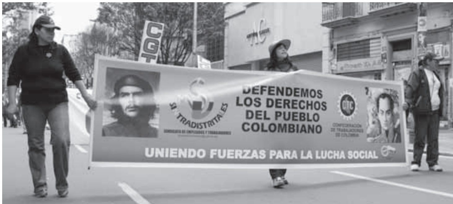
Marcha de los afiliados a Sintradistritales por la carrera séptima de Bogotá.

Son alrededor de 19 mil los trabajadores beneficiados con el acuerdo logrado entre los sindicatos del Distrito Capital y la administración de la ciudad, en cabeza de Samuel Moreno