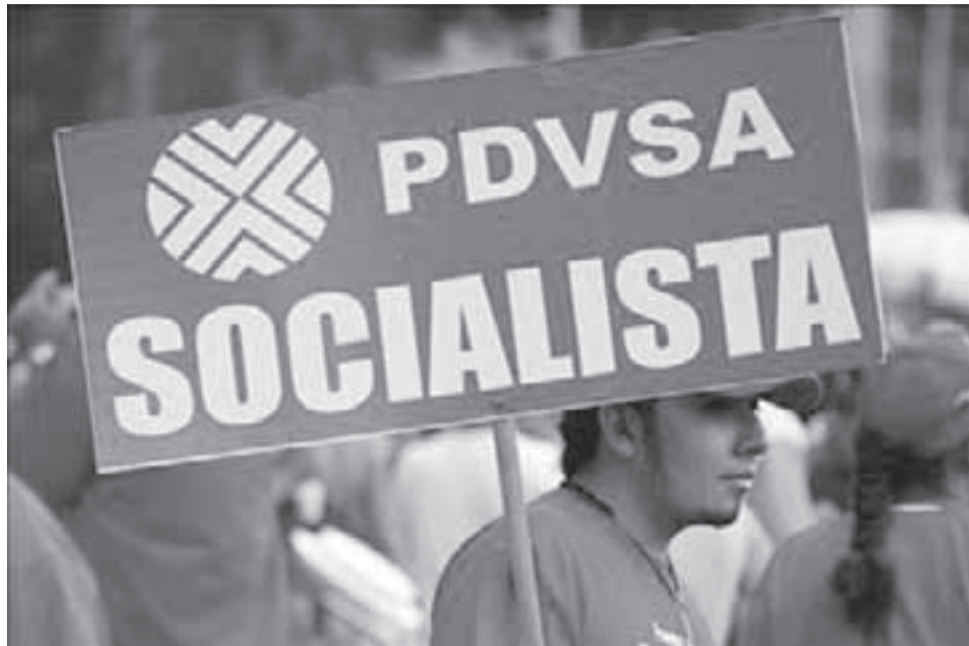
Manifestaciones de trabajadores de PDVSA y venezolanos en general, para rechazar la intromisión norteamericana.