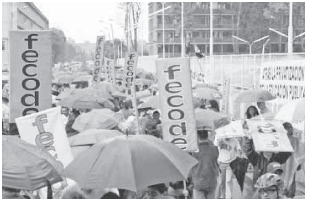
Movilización de educadores contra la privatización.

fundamentales, no están dispuestos a regresar a este modelo”, explicó el Fiscal de la Federación.