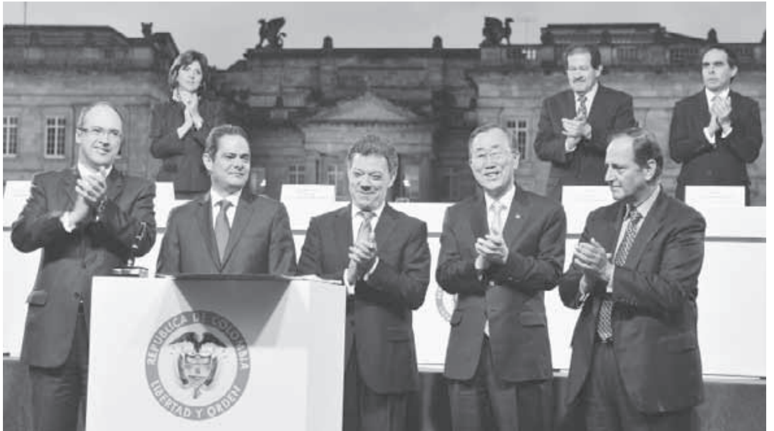
Sanción presidencial de la Ley de Víctimas con la presencia de Secretario General de la ONU, Ban Ki-moon.

El Gobierno de Santos, basado en el control mayoritario de la derecha en el Congreso, ha logrado convertir en leyes sus planes para profundizar la agenda neoliberal