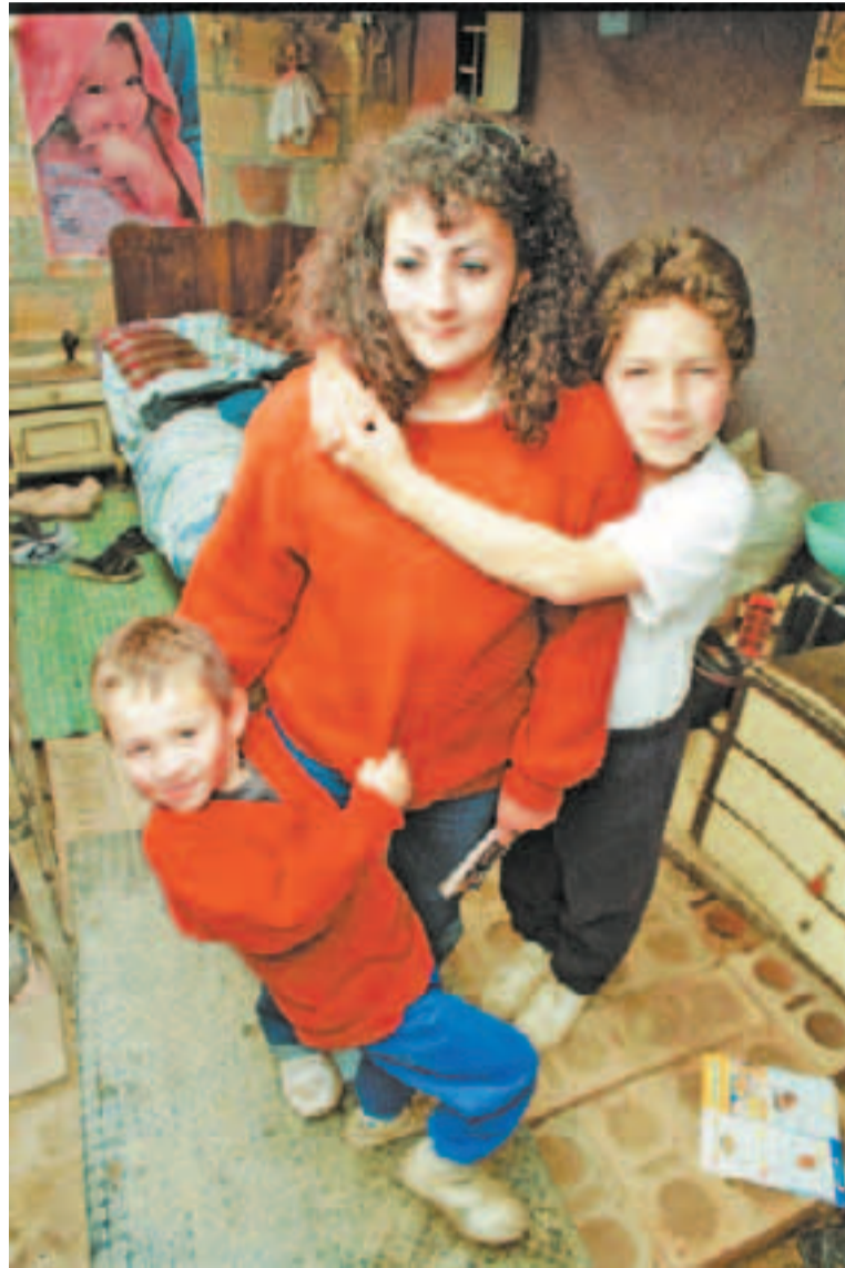
Aun queda mucho camino por recorrer para que la población de Bogotá viva dignamente.

Según los resultados de Sisbén III, el 54,41% de los hogares encuestados viven en arriendo, el 27,07% cuentan con vivienda propia pagada, el 11,48% se encuentran pagando su vivienda y el 7,03% están en otra condición. De otra parte, si bien los sectores visitados en las localidades de Los Mártires, La Candelaria, Antonio Nariño y Barrios