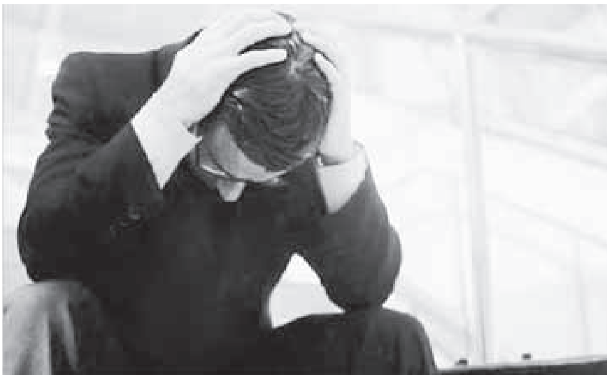
La inflación acumulada y descontrolada genera incertidumbre en los trabajadores.

Lo primero que sobresale del cuadro es que se trata de 5 actividades económicas significativas, relacionadas con la canasta familiar o salario real de los hogares de la gente que vive del trabajo. Igualmente, de dichas actividades, resalta por su alto índice de inflación la educación; seguida de una actividad fundamental como es la relacionada con proporcionar bienes alimentarios y la salud. Finaliza por sus bajos niveles de inflación el transporte y la vivienda.