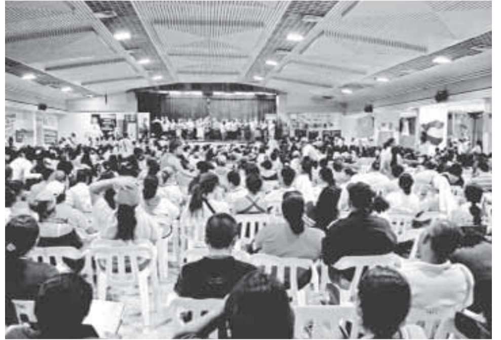
La paz es posible y en esa dirección es la realización del Encuentro de Barrancabermeja.

La iniciativa con amplio apoyo fue de la Asociación Campesina del Valle del