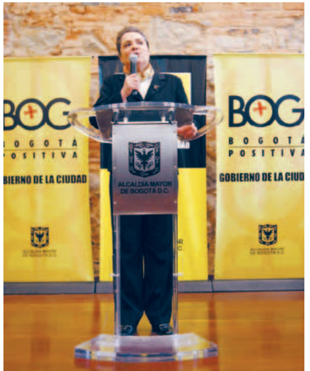
Clara López Obregón asume la Alcaldía de Bogotá en representación del PDA, el pasado viernes 10 de junio.

La alcaldesa encargada elogió los avances sociales que la capital ha tenido a lo largo de la administración. Hechos relevantes que no son registrados en los