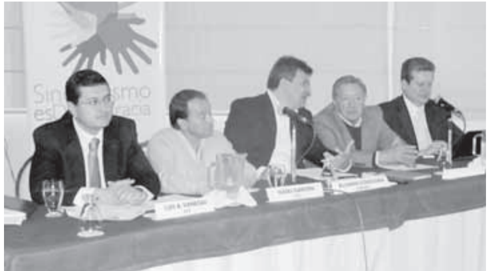
En rueda de prensa dirigentes sindicales de la CUT, la CTC y miembros de Codhes presentaron el informe.

M ientras sindicalistas colombianos hicieron grandes esfuerzos para que Colombia fuera excluida de la lista de países que cada año es analizado en la Conferencia de la Organización Internacional del Trabajo, OIT, organizaciones como la Confederación Sindical Internacional, CSI, presentó un informe que da cuenta de la crisis humanitaria que se vive en el ámbito laboral en el país.