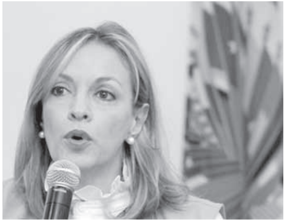
María Emma Mejía, secretaria general de Unasur

El regreso a Honduras del ex presidente Manuel Zelaya y el posterior levantamiento de sanciones al Gobierno de ese país, por parte de la OEA, que permitieron el reintegro inmediato de Tegucigalpa al foro regional, provocó fisuras el interior de las filas del Frente de la Resistencia de Honduras, que lidera el propio Zelaya.