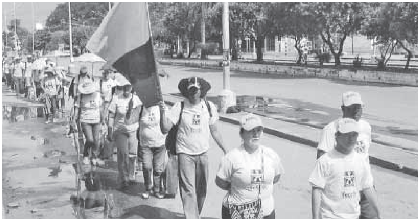
Los caminantes saliendo de Barrancabermeja, en su camino a la Capital del país.

Desde 1997 alrededor de 800 docentes de Santa Marta venían trabajando con Órdenes de Prestación de Servicios, OPS, firmadas con ese Distrito. Alrededor de 500 mil pesos recibían como pago durante cinco meses al año.