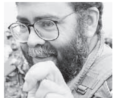
Alfonso Cano, comandante de las FARC-EP.

Por la extensión no es posible publicarla en este semanario, pero puede leerse en los dominios siguientes: http://www.público.es/internacional/381305/ http://www.pacocol.org http://carloslozano-guillen.blogspot.com/