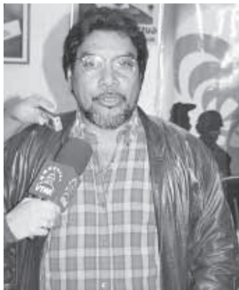
Oscar Figuera, Secretario General del PCV.

Gobierno del presidente Hugo Chávez, dejar sin efecto la cooperación en materia de inteligencia con el Gobierno y la Policía colombianos, por considerar que la manera como está concebida esta colaboración, viola de manera flagrante la soberanía nacional de ese país.