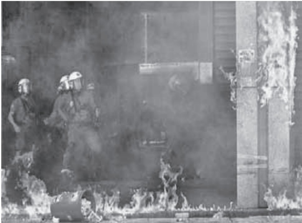
Grecia, se encienden sus calles.