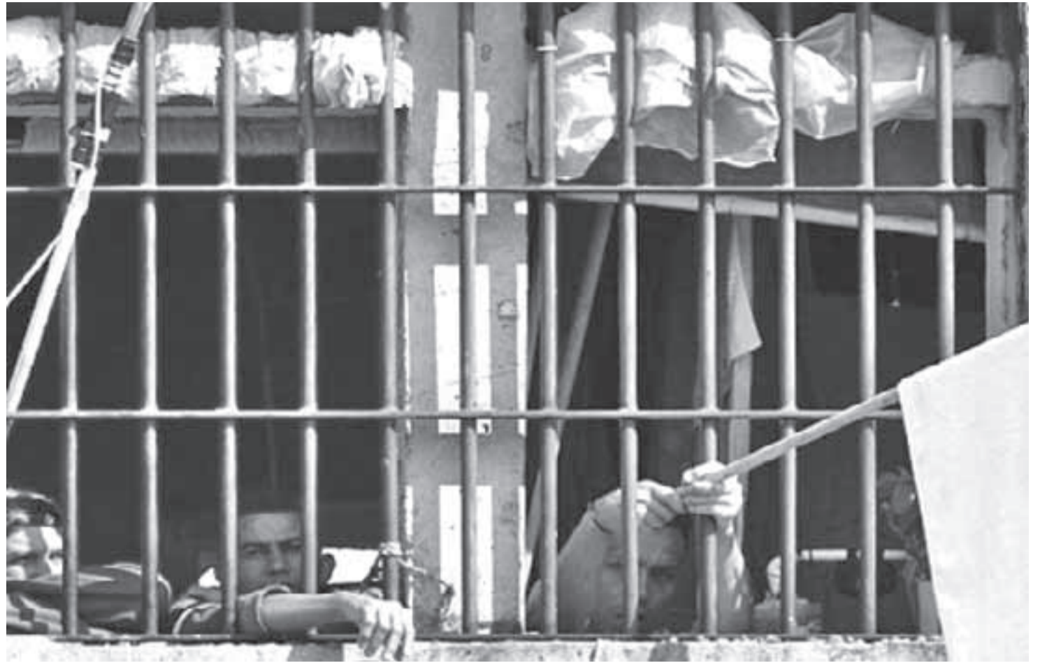
El hacinamiento y el maltrato del INPEC continúan siendo los principales factores de inestabilidad en las cárceles colombianas.

El patio 8 de presos políticos fue revuelto con delincuentes comunes. Este patio ha sido el mejor en todo tiempo, aquí hay convivencia sana. Tenemos en este momento cinco casos de gente que no puede convivir en el patio, pero la guardia dice que sólo interviene cuando haya muerto. Hay el caso de un señor que le metieron dos paramilitares que estuvieron en la masacre de su familia. Usted entenderá que son cosas demasiadas dolorosas para una persona saber que quien le ha matado a su familia está