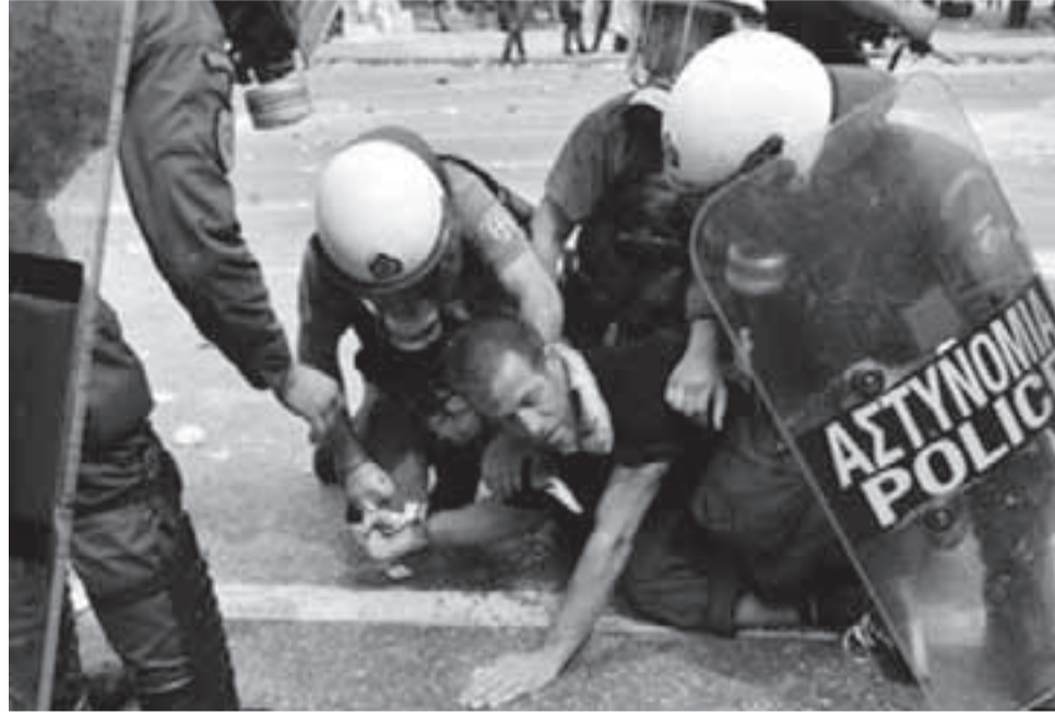
Aspecto de las brutales palizas contra manifestantes en Atenas.

El año pasado, ante la posibilidad de una quiebra financiera, Grecia tuvo que acudir a nuevos préstamos de la banca internacional, que los otorgó imponiéndole a cambio una dura fórmula de recorte en el gasto público y afectación de