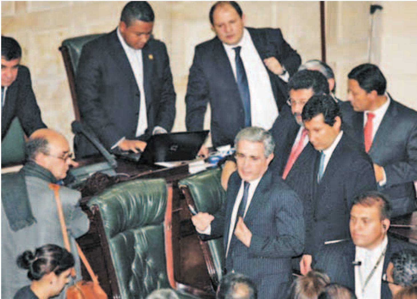
Uribe y sus defensores en constante animadversión en contra de las víctimas y reconviendo a sus investigadores.