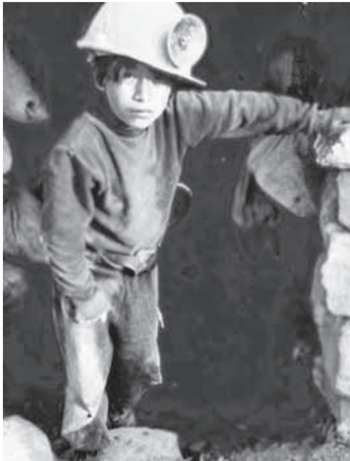
Explotación laboral infantil.

Era sospechosa la disminución de las cifras en un país que no toma en serio la erradicación del trabajo infantil y que pretende, con medidas paliativas, coyunturales y desarticuladas, darle salida a un tema que es de orden estructural. Las cifras son dicientes: 20 millones de pobres, cuatro millones de desplazados, y 2'562.000 desempleados; sumado a lo anterior un 58%