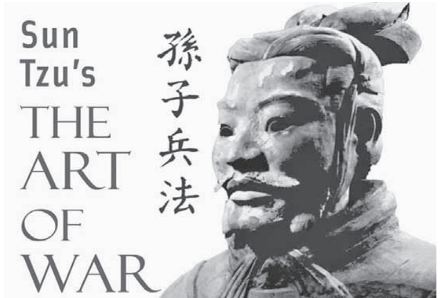
Sun Tzu. El Arte de la Guerra.

Los militares y la clase dominante en Colombia, que adelantan la guerra desde hace seis décadas sin definición, cada cierto tiempo anuncian el “fin del fin”, creyendo que de manera caprichosa y por decreto pueden acabarla, certificando la defunción de los alzados en armas. Los analistas oficiales y de la derecha se revientan los sesos para analizar el fenómeno del conflicto, el cual, por cierto, en los últimos ocho años de los dos Gobiernos de Álvaro Uribe Vélez fue negado, porque según la versión oficial, la guerrilla está casi que derrotada. El ministro de Defensa, Rodrigo Rivera, para justificar su incapacidad y los pocos resultados que presenta en una ofensiva insurgente de varias semanas, dice que es la “pabloescobarización” de la guerrilla, que perdió todo norte revolucionario, como si alguna vez se lo hubieran reconocido con sinceridad para una solución pacífica y dialogada del mismo. Aunque algunos derechistas del uribismo le cuestionan a Rivera haber