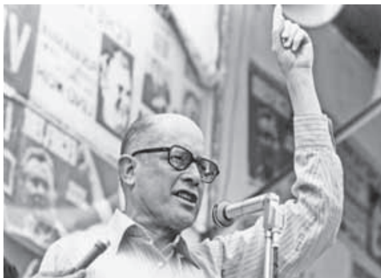
Gilberto Vieira White comunista ejemplar.