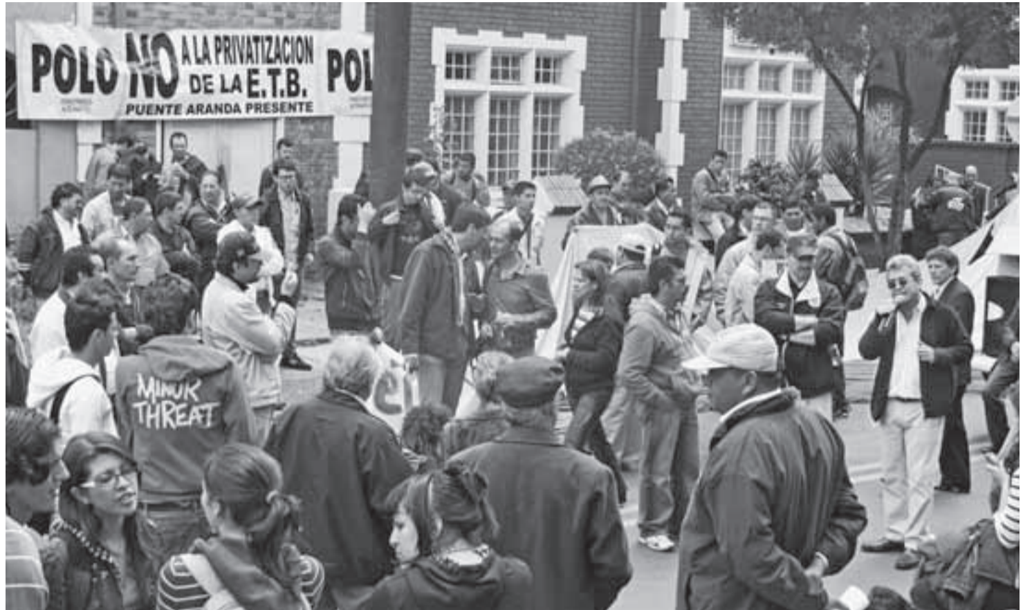
Aspecto de la toma del Concejo de Bogotá hecha por trabajadores de ETB.