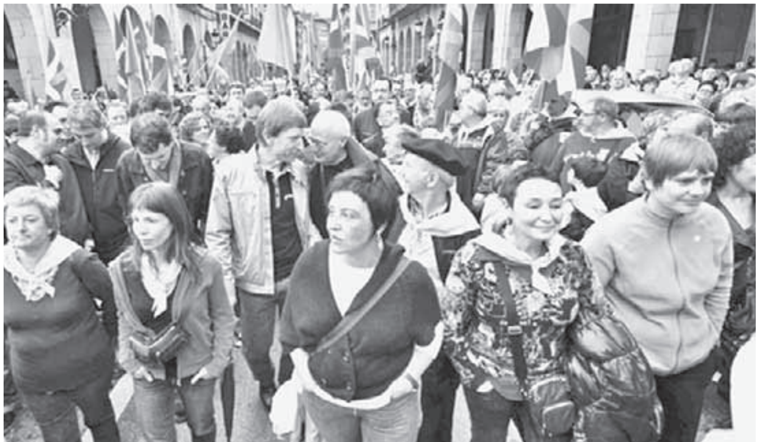
Batasuna fue ilegalizada por el Estado español y ahora quiere hacer lo mismo con Bildu tras su victoria en el País Vasco.

U n hecho político de gran significación ocurrido en las elecciones españolas del 22 de mayo, no ha sido destacado debidamente por la prensa nacional: la victoria de la nueva coalición de izquierda Bildu. La coalición triunfante la integran Eusko Alkartasuna, Alternatiba- en esta forma escriben la palabra sus integrantes- y algunos independientes que provienen de la ilegalizada Batasuna. El triunfo debe valorarse más, si se tiene en cuenta que solo un poco antes de las elecciones, el Tribunal Supremo legalizó el nuevo movimiento. Otro elemento que potencia las consecuencias políticas al resultado electoral de Bildu, es el hecho que algunos le atribuyen cercanía ideológica con ETA, porque tiene algunas propuestas similares a este grupo armado, en tregua unilateral y búsqueda de acuerdos políticos para la paz.