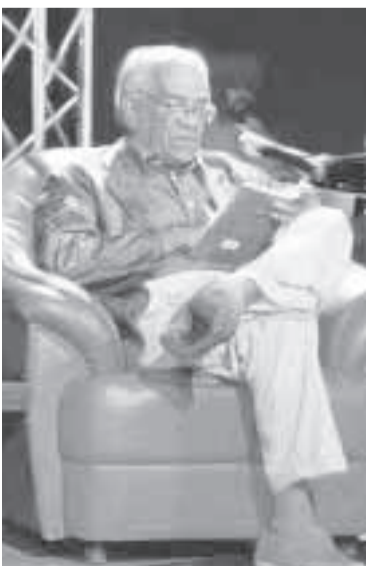
Derek Walcott, premio Nobel 1992