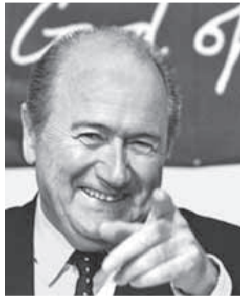
Joseph Blatter, presidente de la FIFA.

El hecho de entregar a Colombia la sede del Mundial Sub 20, se puede interpretar como un premio otorgado por la dirección de la FIFA para comprar votos que permitan la reelección de Joseph Blatter como Presidente de la FIFA, y la renuncia Jack Warner como encargado de la organización del Mundial en Colombia. Esto en medio del escándalo por una alta inversión, que debe garantizar un retorno de 7.2 millones de dólares, generados por el consumo diario de cerca de 36.000 visitantes externos, que gastarán entre 150 y 200 dólares diarios por persona en hoteles, alimentación, diversión y transporte, entre otros. Esto se complementa con la adjudicación inmediata de contratos, el sobrecosto de insumos para la remodelación de estadios, la adjudicación de entradas (reventa de boletería), las convocatorias para “voluntarios logísticos” sin remuneración salarial, el desalojo de los trabajadores de las áreas de comidas típicas en Bogotá y otros estadios de Colombia,