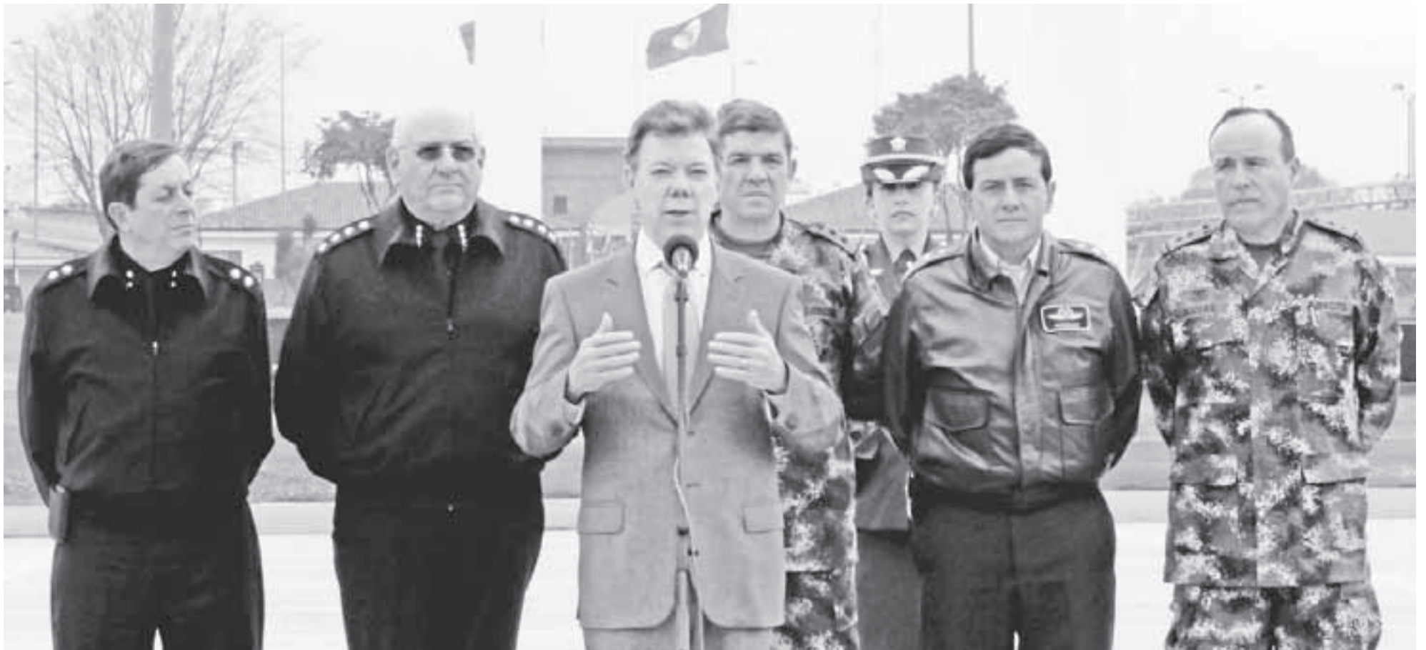
El presidente Juan Manuel Santos rodeado de la cúpula militar.