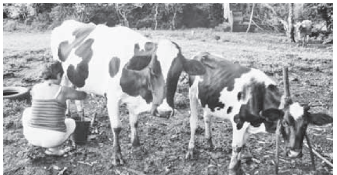
Los pequeños productores son los más afectados.

El actual Gobierno del presidente Santos, expidió el 27 de mayo de 2011, el decreto 1880 que restituye nuevamente la legalidad para que pequeños comercializadores y productores puedan volver a vender la leche cruda para hervir, manteniendo las condiciones sanitarias que se exigían en el Decreto 616 de 2006. Los intereses monopólicos de las pasteurizadoras que iban por el cien por ciento del mercado quedan suspendidos