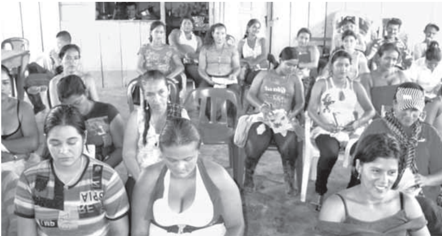
Unión Peneya, rechaza la represión oficial y la discriminación.