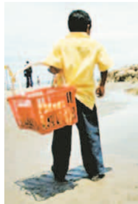
Niños trabajadores en Cartagena.

Los gobernantes locales se hacen elegir, llegan, pasan y se van en nombre de una Cartagena paradisíaca en la que ni ellos mismos creen. ★