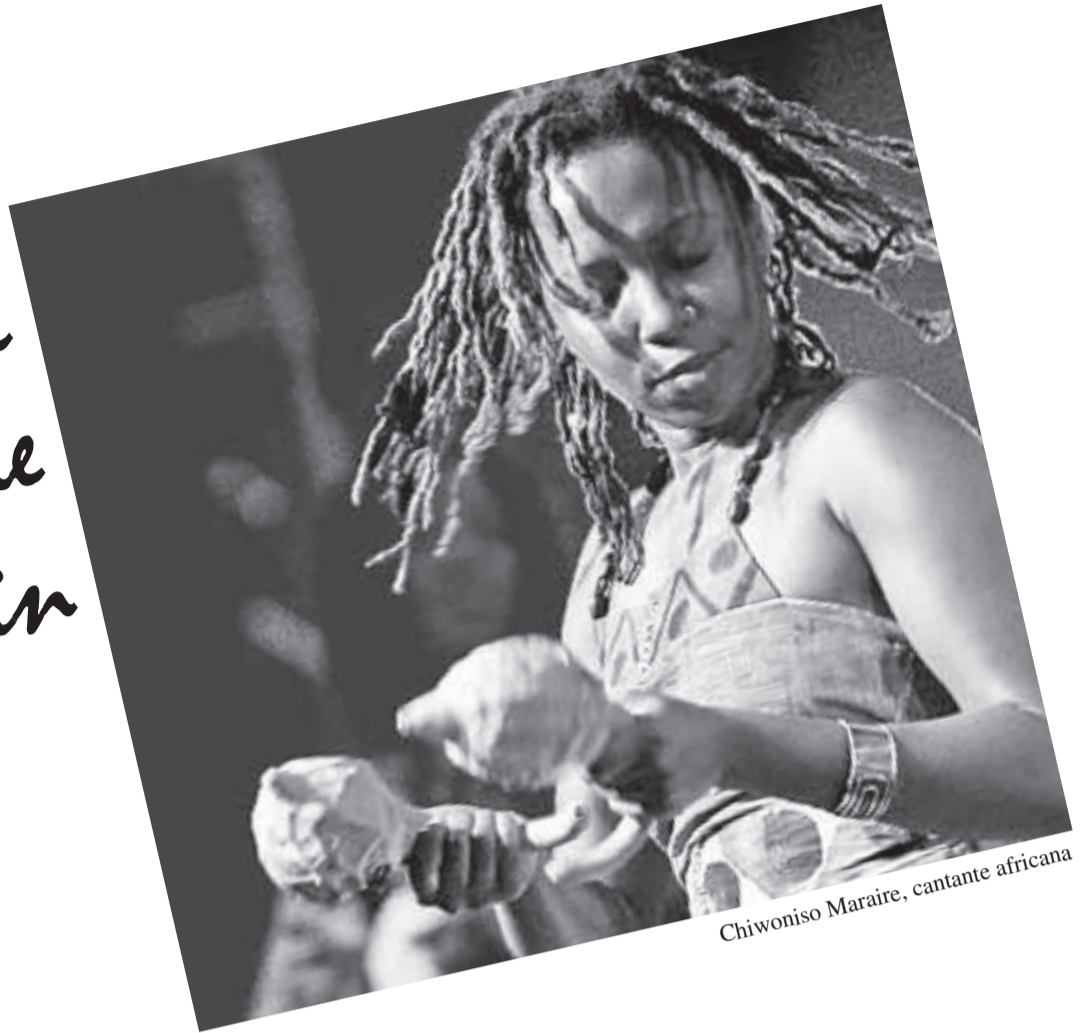
Chiwoniso Maraire, cantante africana

Este sábado 2 de julio comienza la XXI versión del Festival Internacional de Poesía de Medellín. Extraordinario acontecimiento cultural, un Festival como no hay otro