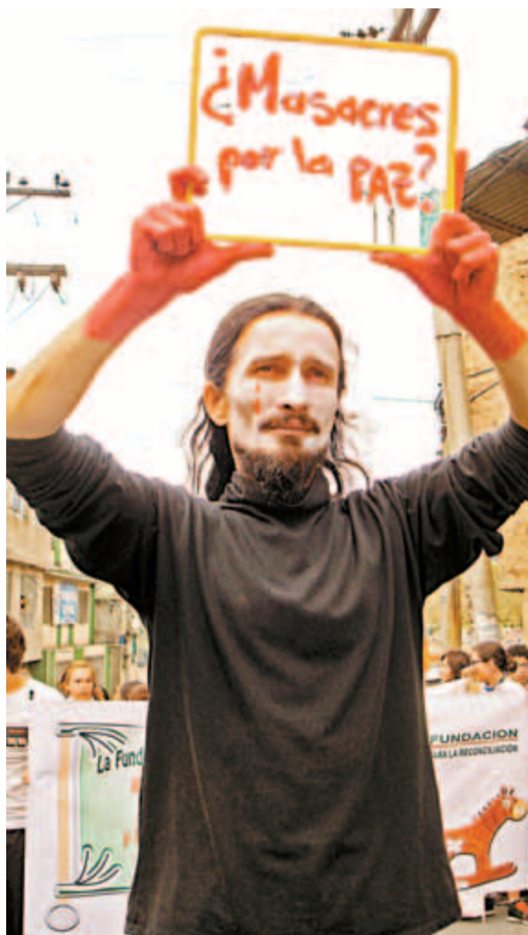
Los grupos de teatro amenazados en el sur de Bogotá protestaron contra los que infectan el ambiente de paz en el país.