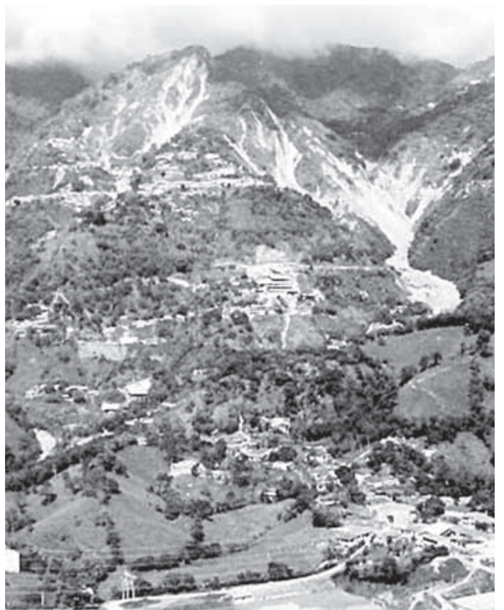
En la parte superior de la foto se encuentra actualmente la cabecera del municipio de Marmato. La multinacional quiere desplazar el pueblo hasta el caserío de la parte inferior de la gráfica, para hacer minería a cielo abierto. El cerro da cuenta del impacto ambiental que deja la explotación de oro.

La explotación de oro a gran escala y sin políticas de mitigación de los efectos ambientales, culturales y socioeconómicos, producirá un crecimiento de la problemática social en un municipio caldense