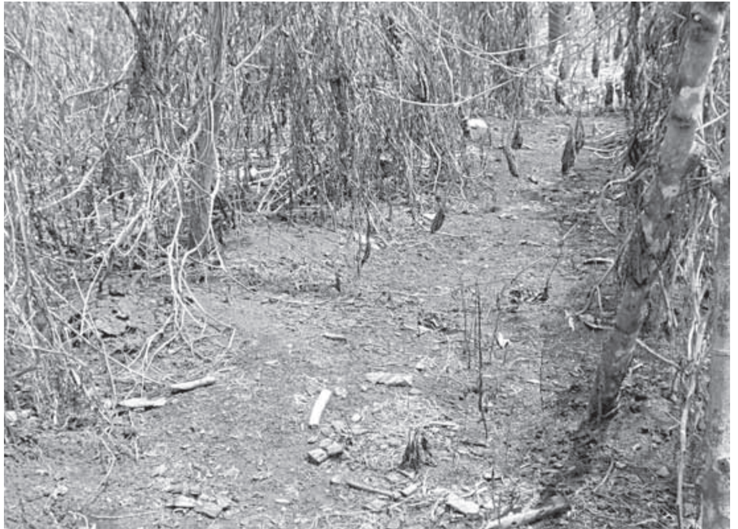
Las fumigaciones en el sur del país envenenan el medio ambiente y por igual ataca a humanos, fauna y flora sin misericordia.

En julio y agosto de este año, en las veredas de Puerto Nuevo, San Jorge, El Charcón, Puerto Cachicamo, Alto Cachicamo, La Carpa, Alto Angoleta y Bajo Angoleta, El Tigre y La Rompida, entre otras, se llevaron a cabo procedimientos de fumigación, no obstante que por lo menos el 97% de la coca ya se había eliminado. Pese a que las veredas La Argentina y Miraflores son Zona de Reserva Natural, han sido objeto de fumigaciones.