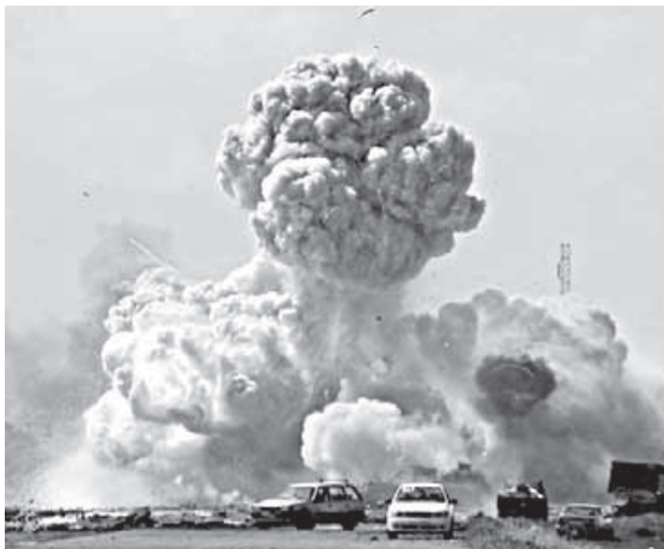
Imagen de la fuerza de los bombardeos de la OTAN en Libia.