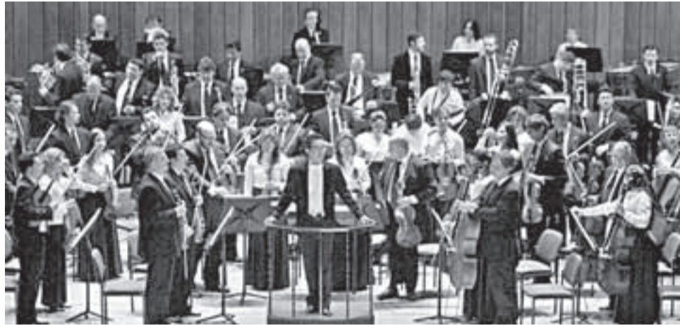
Orquesta Filarmónica de Bogotá.

La Orquesta Filarmónica de Bogotá es considerada una de las mejores de América Latina. Y su público, uno de los más cultos y exigentes. Ambos se citan, cada fin de semana, en un ritual que se cumple en el auditorio León de Greiff de la Universidad Nacional