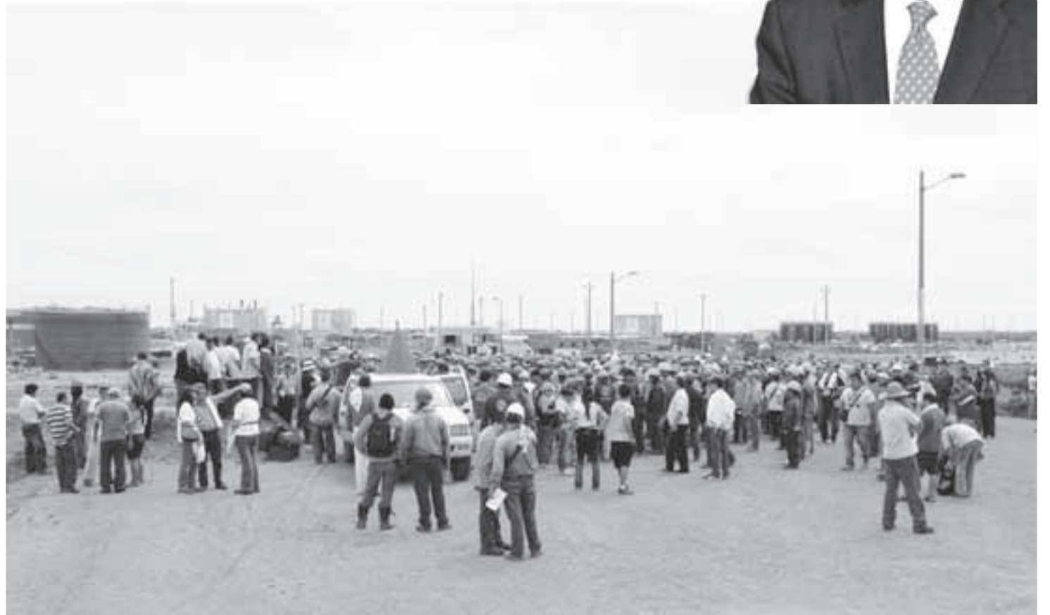
En el recuadro, arriba a la derecha, Angelino Garzón, Vicepresidente de la República. Abajo, la Caravana Humanitaria de solidaridad con los trabajadores petroleros de Puerto Gaitán que comprobó las insalubres condiciones en las que son obligados a trabajar.