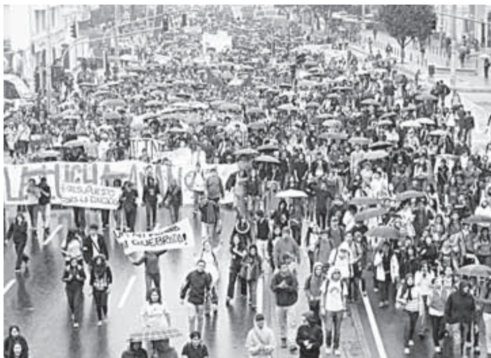
Los estudiantes se han movilizado a lo largo y ancho del país en contra de la reforma educativa mercantilista del Gobierno de Juan Manuel Santos.