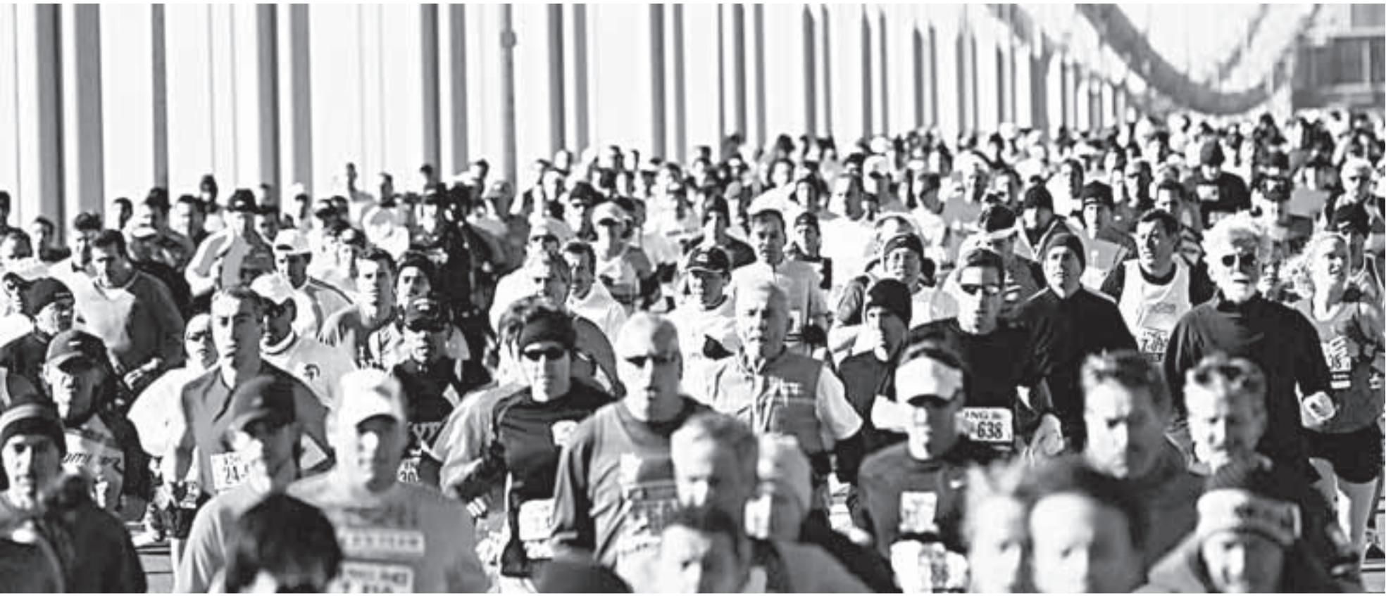
La primera década del siglo XXI se considera perdida en la lucha contra la pobreza en el mundo.