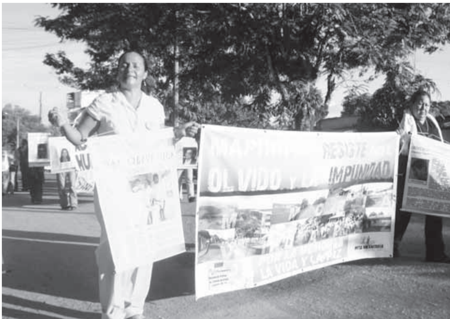
Mientras los medios le restan importancia al sufrimiento de las víctimas de masacres, estas esperan que se les trate con dignidad.

La masacre existió y no se puede eludir, “tampoco se puede minimizar la responsabilidad del Estado”: dijo el abogado Eduardo Carreño en rueda de prensa ofrecida por el Colectivo de Abogados José Alvear Restrepo, CCAJAR