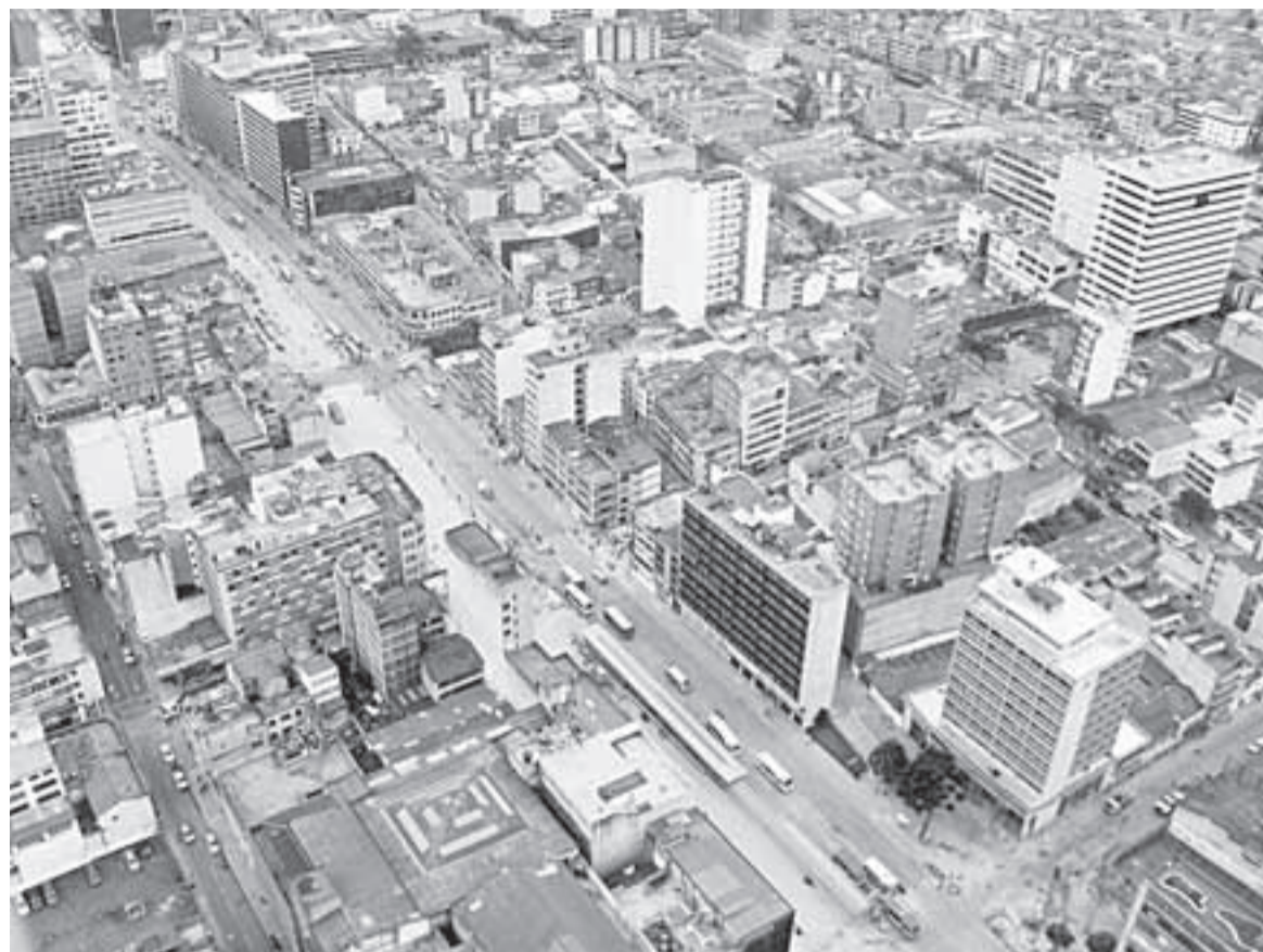
No se pueden negar los avances sociales que la Capital ha tenido gracias al Gobierno del PDA.

El Departamento Administrativo Nacional de Estadística, DANE, informó a través de una encuesta, que la pobreza en la Capital de la República disminuyó en un 9%