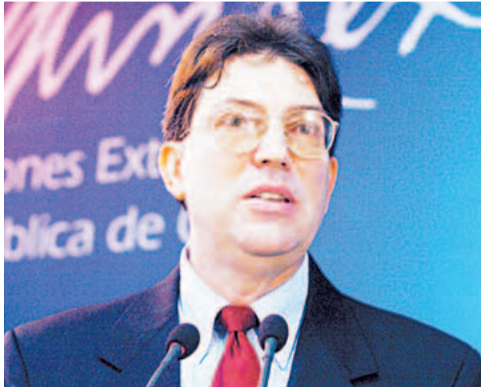
Bruno Rodríguez, canciller cubano.

El bloqueo a Cuba, a la luz del Derecho Internacional, constituye un acto de genocidio, dijo ante la Asamblea General de la ONU, el canciller cubano Bruno Rodríguez