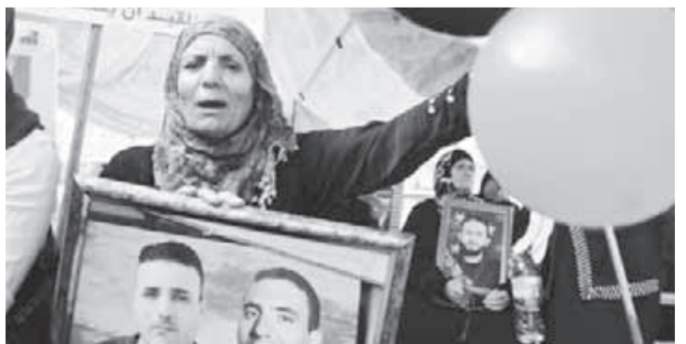
Palestinos celebran la liberación de sus hijos.

En el pasado, los israelíes habían hecho ya intercambios similares de prisioneros, incluso en 2008 liberaron a un nutrido grupo de palestinos privados de la libertad, a cambio de los restos de dos soldados capturados y muertos por el