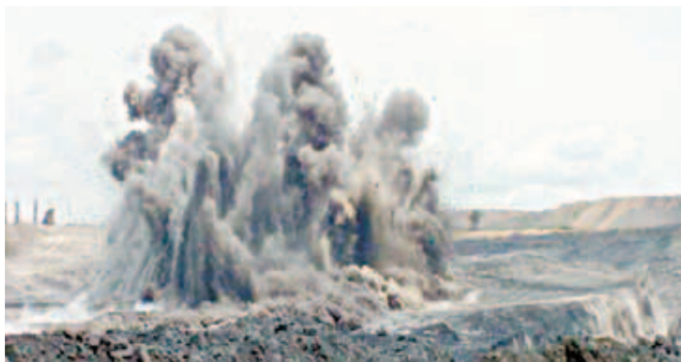
Los químicos de las detonaciones se revuelven con el polvillo del carbón y el viento las lleva a los ecosistemas y a las poblaciones vecinas.

“Es paradójico carbón para la energía eléctrica ellos no la tienen