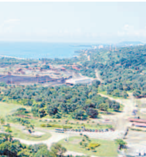
ualmente se planea la construcción de otro.

que se lleven el generación de en otros países y n como debe ser”