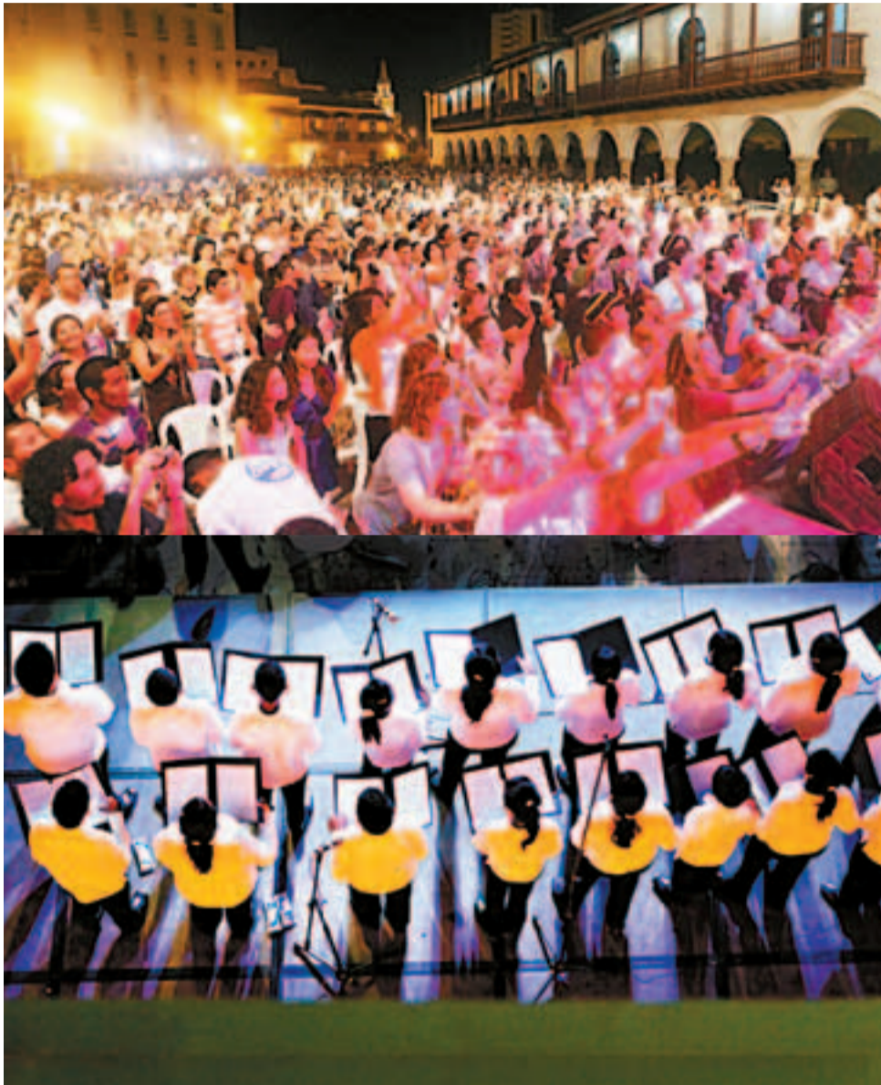
El “Hay Festival” no pudo faltar el cuestionamiento a fondo de la política estadounidense y la crisis del capitalismo.

El corresponsal de VOZ en La Heroica destaca un interesante conversatorio sobre las lacras del capitalismo, que se filtraron en el elitista “Hay Festival”