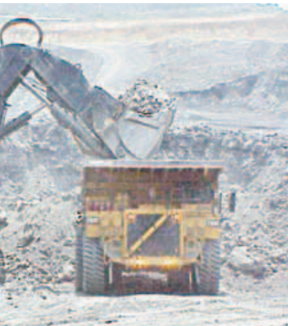
en las vías que produce la pesada maquinaria. No ven que las invertidos allí.