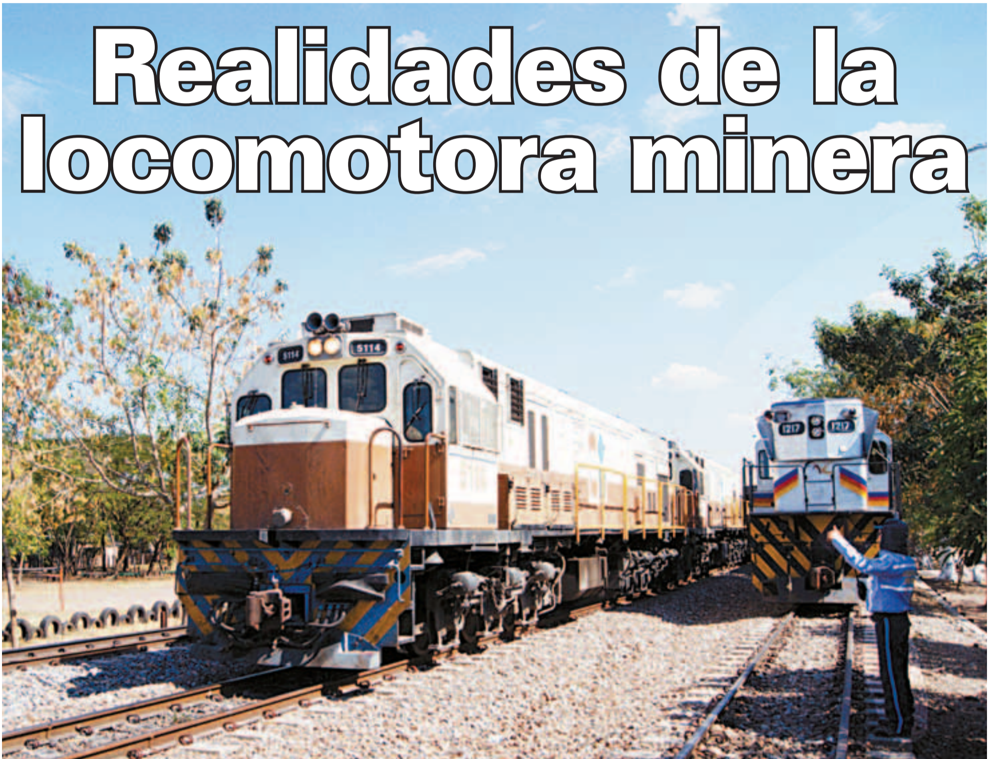
Paso del tren cargado de carbón hacia el puerto, por la población de Bosconia, departamento del Cesar.

Consecuencias nefastas de la explotación del carbón sin planes de mitigación social y ambiental, en los departamentos del Cesar, Guajira y Magdalena. Se denuncia contubernio entre el Gobierno y las empresas para birlar derechos de las comunidades y los trabajadores. La miseria aumenta y urge inversión social en comunidades aledañas a las minas.