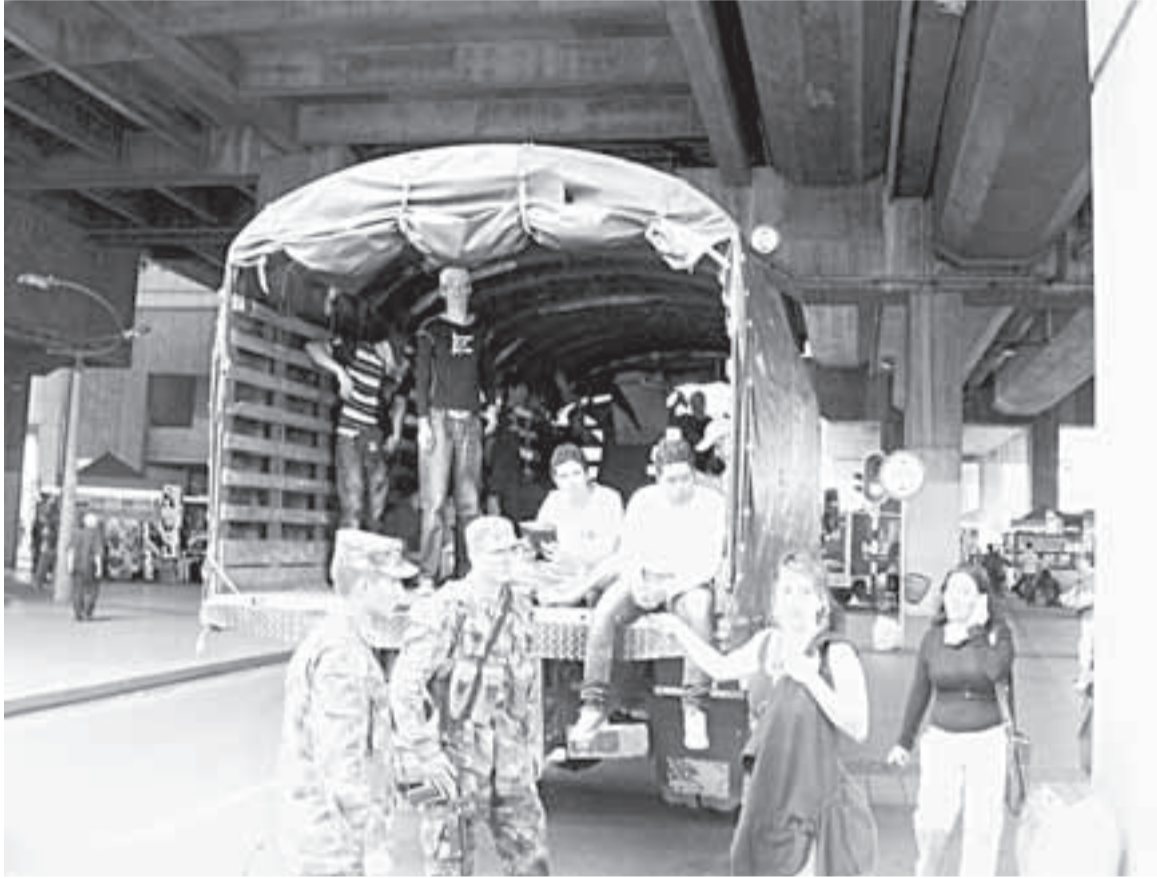
Jóvenes no pueden ser llevados en “batidas” porque es una retención ilegal.

A pesar de que la Corte Constitucional en una sentencia proferida el año pasado sostiene que el Ejército Nacional no puede realizar las famosas “batidas” en calles o lugares públicos, es común ver a los militares en TransMilenio haciéndolo