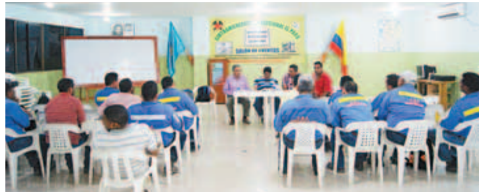
Los trabajadores sindicalizados de la La Loma utilizan parte de su poco tiempo libre para hacer sus reuniones.

Obreros de Glencore en la mina de la Jagua de Ibirico, comentan sus viacrucis cuando han sufrido hernias discales, enfermedades pulmonares y accidentes de trabajo por la rigurosidad de sus labores. Denuncian una confabulación entre las