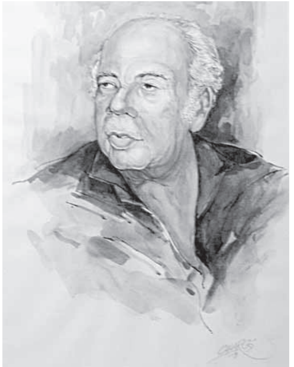
Jorge Artel. Retrato de Carlará.

Su alma acunada en el África, la omnipresencia del mar y sus brisas, en la natal Cartagena; el trasegar por el Caribe, decantaron su sensibilidad y sembraron sus versos de una seductora musicalidad. Los problemas y los sufrimientos ancestrales son convertidos por la pluma de Jorge Artel en poesía plena de ritmos y metáforas deslumbrantes: "Hay un llanto de gaita diluido en la noche... "Es una serpiente brotada de cien cabezas". "Sobre el cuero donde los tamborileros-sonámbulos dioses nuevos, que repican alegría, aprendieron a hacer el trueno con sus manos nudosas todopoderosas para la algarabía". "Todas mis horas arderán/ en la apretada hoguera/ de las sensuales danzas de mi tierra."