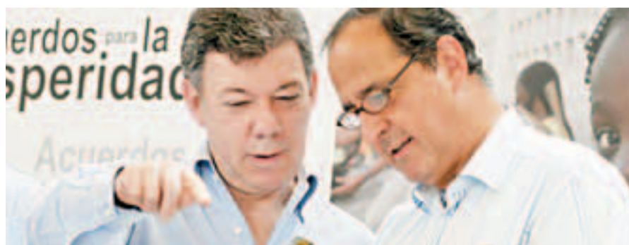
El presidente Juan Manuel Santos y el Ministro de Agricultura, al iniciar un encuentro con líderes campesinos, en Barranquilla, la semana pasada.

Mientras el presidente Santos se dedica al “show” mediático en la entrega de predios rurales, el PDA cuestiona la política de tierras y denuncia fraude en las cifras de restitución. Las víctimas alertan sobre embelecocos en los decretos que reglamentan la Ley de Víctimas, señalan que servirán a los intereses de los usurpadores de tierras.