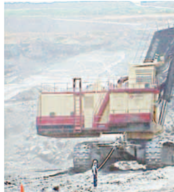
Habitantes y algunas autoridades locales se quejan del daño que las compañías reparan lo causado ni los dineros de las regalías i

Al no haber negociación los trabajadores votaron por la huelga y el domingo 29 de enero se tomaron las instalaciones de la mina. Como respuesta gubernamental se envió al ESMAD, que los golpeó, hirió a uno de ellos pero no los pudo desalojar. De inmediato las organizaciones sindicales iniciaron gestiones ante el Ministerio de Trabajo para que se llegara a una negociación pero la respuesta fue que el pasado viernes 3, el ESMAD y el Ejército rompieron la huelga y los hicieron abandonar la mina. El hecho mereció una conclusión del presidente del sindicato, “Con el nuevo