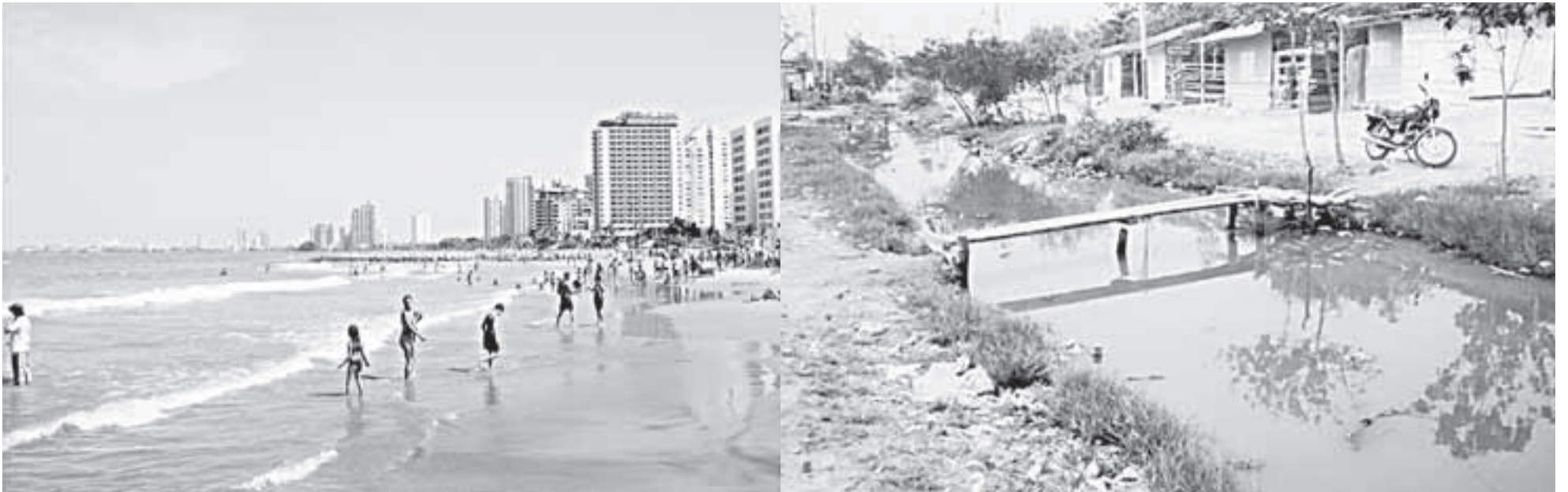
Cartagena de Indias: donde se encuentra la ciudad histórica, amurallada y colonial, con la belleza imponente del océano y la pobreza de una urbe de enormes contrastes, incluyendo la violencia degradante. Fotos Archivo.