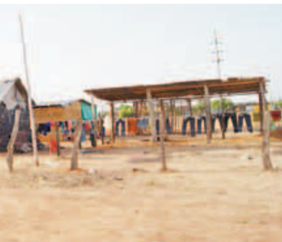
oma, a 300 metros de la mina explotada por la multinacional

que se lleven el generación de en otros países y n como debe ser”