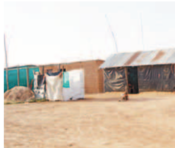
La miseria es evidente en barrios del corregimiento de La Loma.