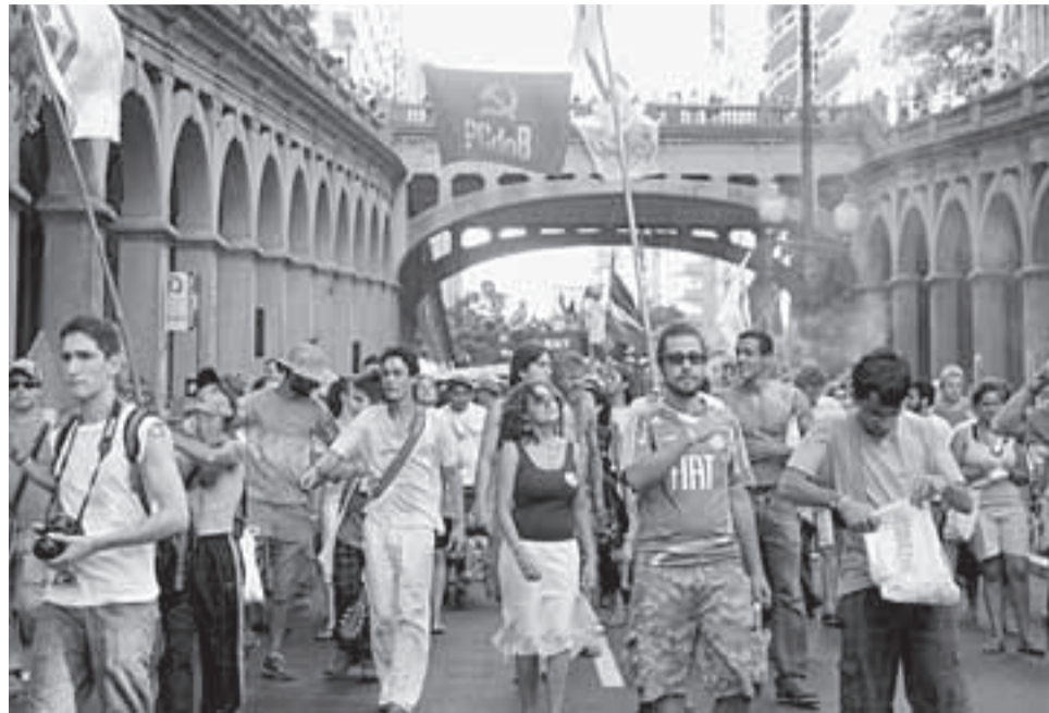
Aspecto de la formidable movilización inaugural del Foro Social Mundial en Porto Alegre.

Realizó un balance de un año de lucha de los “indignados” y llamó a preparar una Cumbre de los Pueblos, del 18 al 23 de junio de este año, en Río de Janeiro, coincidiendo con la Cumbre de las Naciones Unidas Río+20, en la que aspiran a denunciar las falsas soluciones