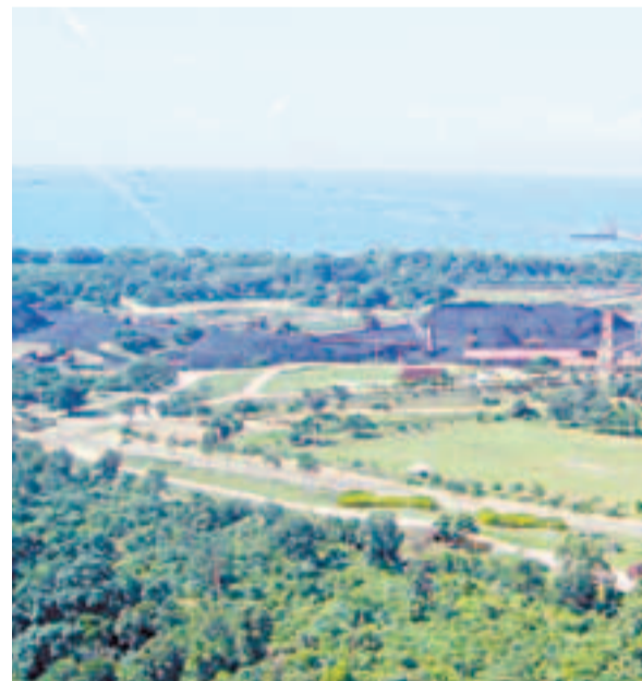
Puerto de embarque del carbón en Ciénaga, Magdalena. Act

“Es paradójico carbón para la energía eléctrica ellos no la tienen