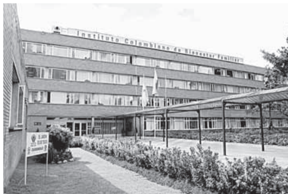
Sede principal del ICBF en Bogotá.