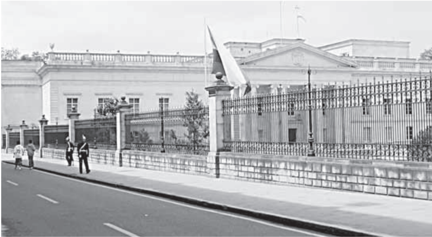
Casa de Nariño