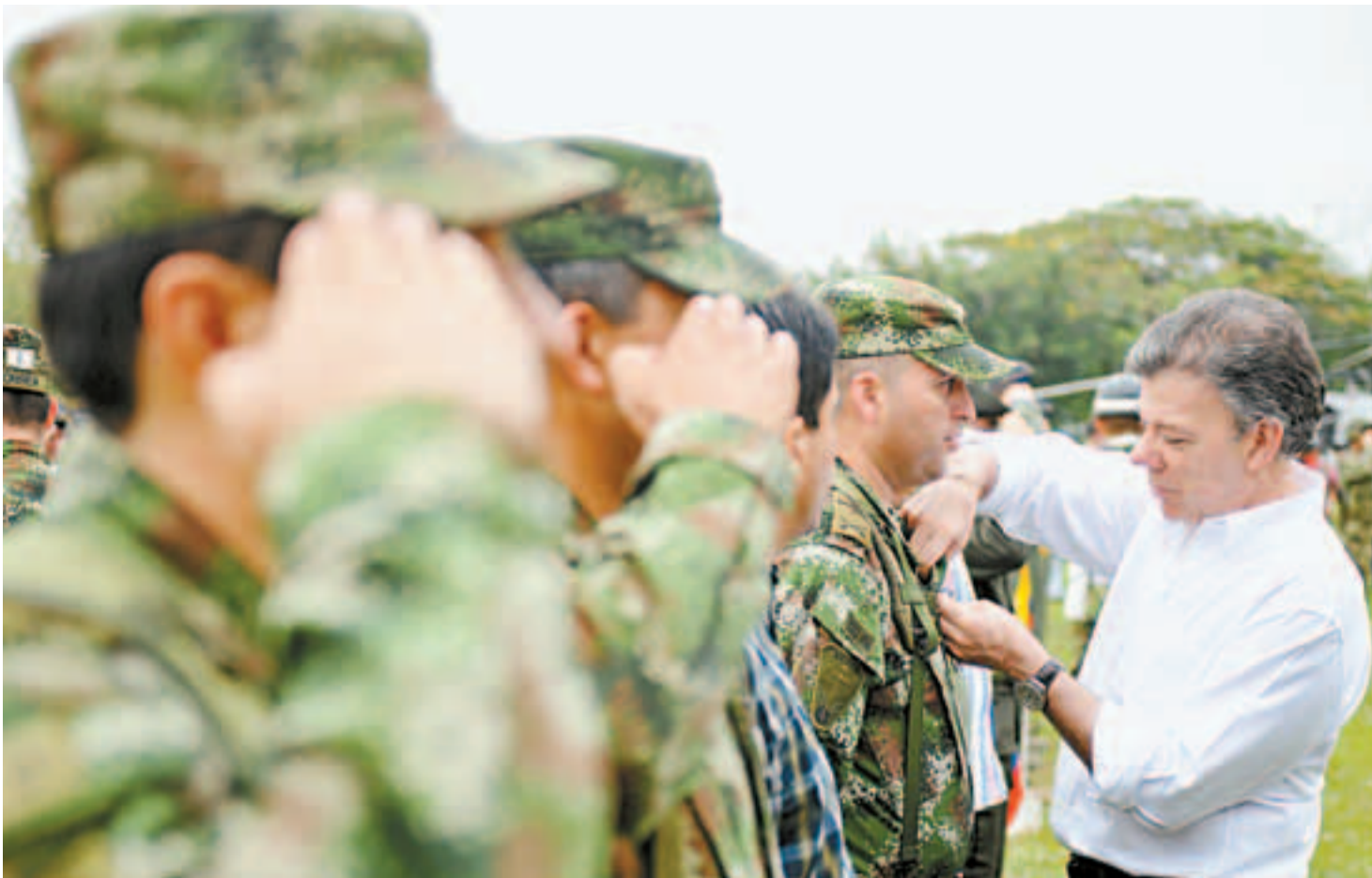
La reforma a la justicia penal militar se complementará con la expedición de una ley estatutaria que delimitaría las actuaciones castrenses.

Inició el trámite de la reforma a la justicia penal militar. Se vislumbra un camino impuesto y apresurado, a ritmo militar, pero también ilegal