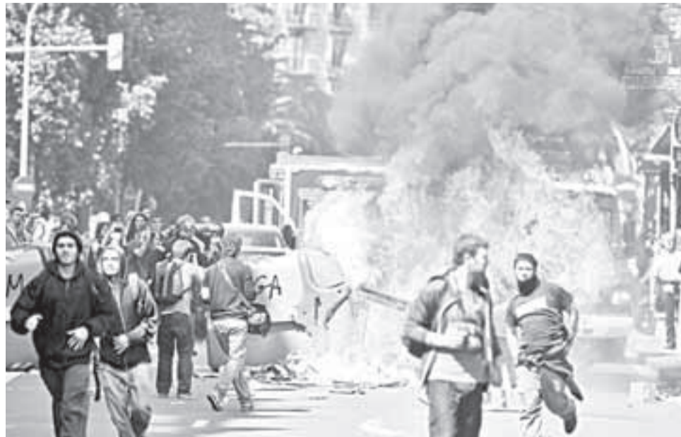
Fuertes disturbios se presentaron entre policía y manifestantes.

Ni los periódicos derechistas niegan el éxito de la huelga general. El Gobierno tuvo que reconocer que cerca de un millón de trabajadores respondieron el