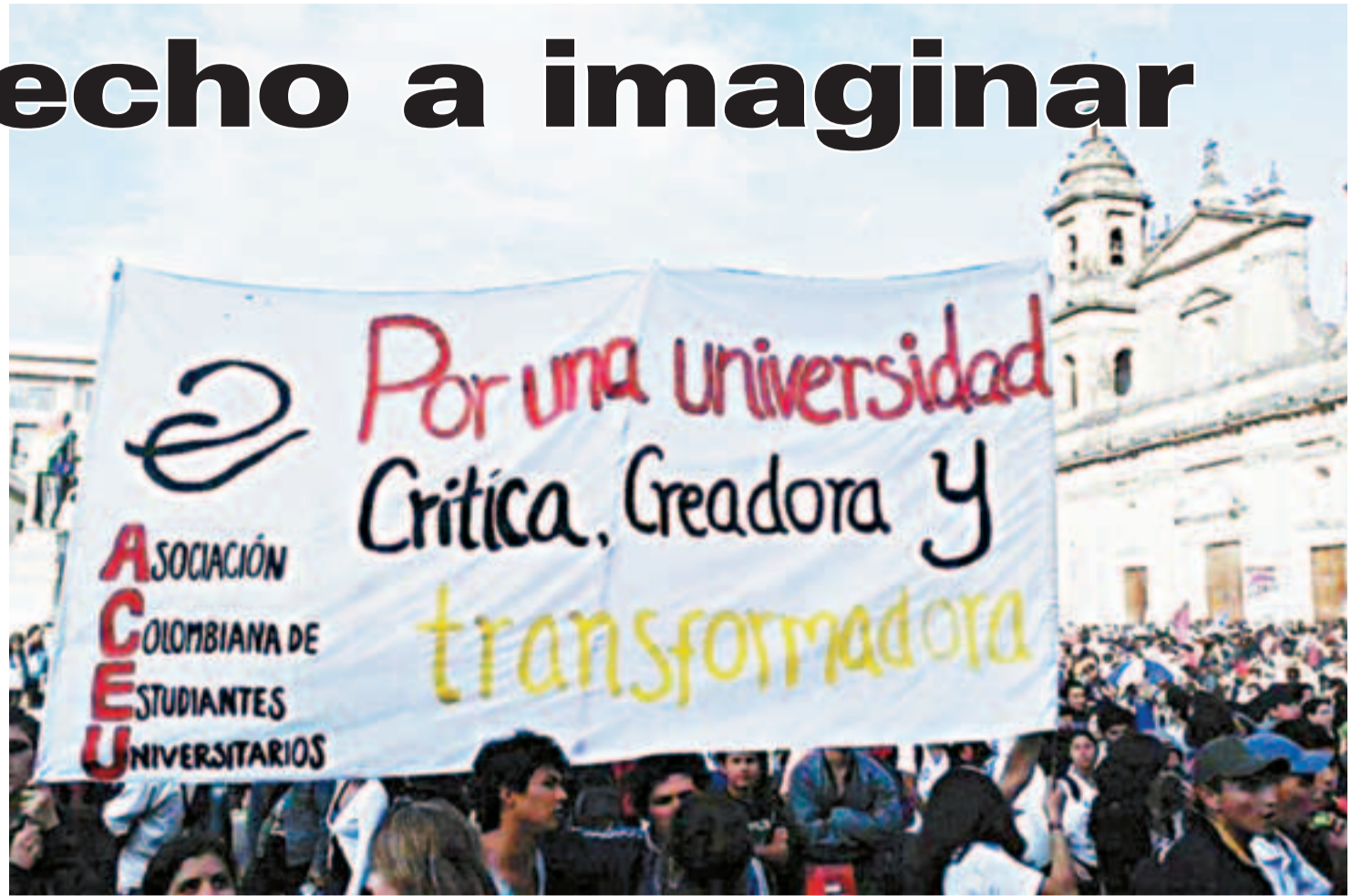
Sobresale el carácter mercantilista que hoy refleja la educación en Colombia.