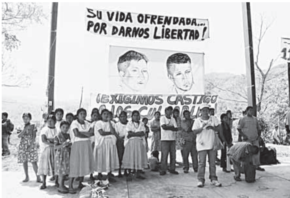
Indígenas del Charco, municipio de Ayutla en México, protestando por la impunidad de una masacre cometida por el Ejército Mexicano en 1998, y rechazando las amenazas contra sus defensores.

CIDH manifiesta preocupación por la instauración de mecanismos destinados a frenar, entorpecer o desmotivar la labor de defensa y promoción de los derechos humanos en algunos países de América, entre ellos Colombia