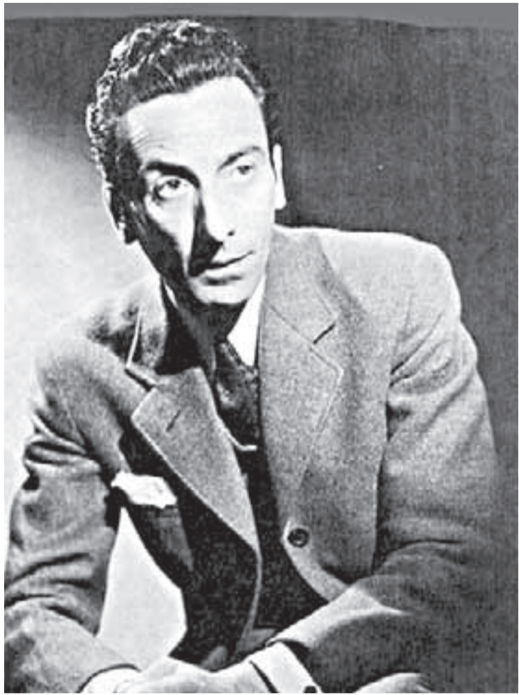
Enrique Santos Discépolo