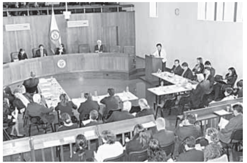
La Corte Constitucional tomó una decisión que puede causar efectos negativos a miles de trabajadores del Estado.

“A este espacio tan importante de concertación, la patronal no le da la importancia que se merece. Cuando firmamos a cinco años la vigencia de la convención, la USO se la jugó por varios aspectos que se estaban dando en la vida nacional: 1. Brindar armonía laboral al interior de Ecopetrol, buscando mayor productividad en la empresa y mayores relaciones de confianza. 2. Blindar durante este período los beneficios convencionales, ya que como estábamos en la era de los uribistas podíamos en cualquier momento perder muchas más prerrogativas convencionales. Nos queda claro que a los patronos hay que confrontarlos para lograr que brinden mejores garantías para los trabajadores”, concluyó la organización de trabajadores. ★