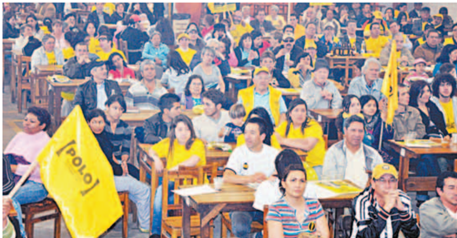
La militancia polista espera la Conferencia Ideológica y llevar la iniciativa en la movilización social. Eso no es doble militancia.

El proceso de construcción del Polo aún no ha terminado. Cerrar las puertas a un intercambio político con el movimiento social es una decisión equivocada