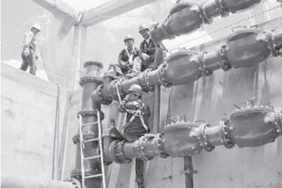
Trabajadores tercerizados de Ecopetrol.

La organización de los trabajadores hace un positivo balance del proceso de revisión de la convención