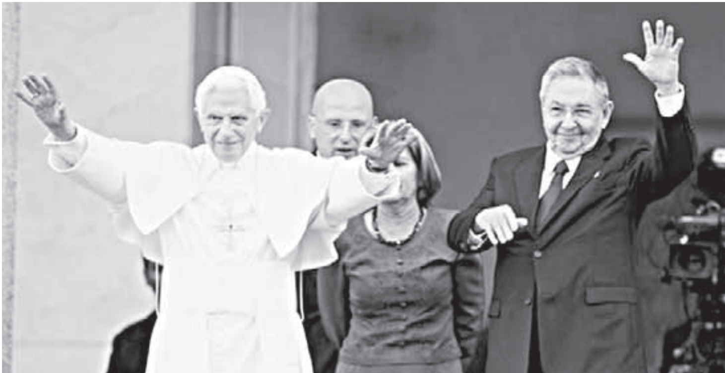
Benedicto XVI y Raúl Castro.

La Iglesia Católica, golpeada por múltiples acusaciones de pedofilia y lacerada por la pérdida de fieles, por cuenta de otras iglesias, buscó entregar un mensaje evangelizador, preñado de contradicciones y silencios