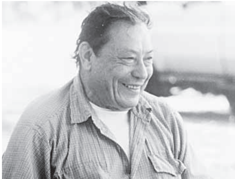
Manuel Marulanda Vélez, comandante de las FARC-EP, fallecido hace cuatro años en las montañas de Colombia. Su figura histórica y legendaria sigue generando polémica.

La pregunta forzada que se hacen analistas y expertos en DIH es si los bombardeos recientes, como otros anteriores, incluyendo el de Angostura (Ecuador) contra Raúl Reyes, se enmarcan en principios de proporcionalidad, cuando la guerrilla no tiene armas para enfrentar los ataques aéreos de los militares colombianos. No son combates, como argumentan los grandes medios y los funcionarios oficiales, sino ataques contra insurgentes inermes, que en tierra no pueden hacer más que correr para evitar las toneladas de bombas que les caen encima. Amén de los efectos colaterales contra campesinos y sus propiedades, ubicados cerca de los objetivos de la Fuerza Pública. Es lo que se llama tierra arrasada en una guerra regular e irregular, inaceptable en el DIH. Aún la guerra, con todos los signos de barbarie y de tragedia, tiene unas normas para atenuar el rigor, para proteger a los civiles e inclusive a los combatientes en estado de indefensión.