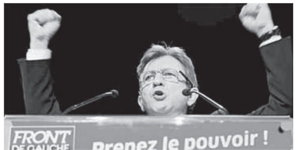
Jean-Luc Mèlenchon, candidato presidencial de la izquierda en Francia.

Cuando se comparan los programas de los diferentes candidatos a la presidencia de Francia se identifica el del Frente de Izquierda como el más apto para dinamizar los cambios que la crisis europea requiere. Tiene un plus