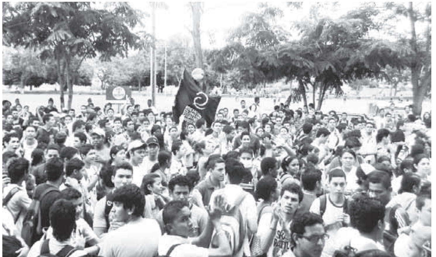
ACEU lideró en la Universidad de Córdoba las manifestaciones por la reforma educativa del pasado año.