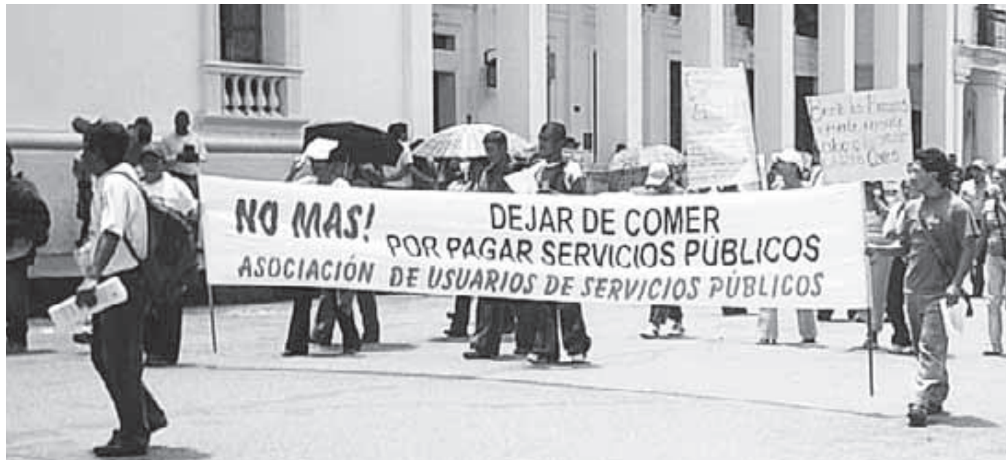
Los costos de la energía son tan altos que muchas familias prefieren reducir artículos de la canasta familiar, para cumplir con el pago a la Compañía y no sufrir el corte del servicio.

En Santander de Quilichao, 350 usuarios exigieron parar los embargos de la Compañía contra los usuarios y el municipio por deuda de alumbrado público. En Timbío, el presidente del Concejo