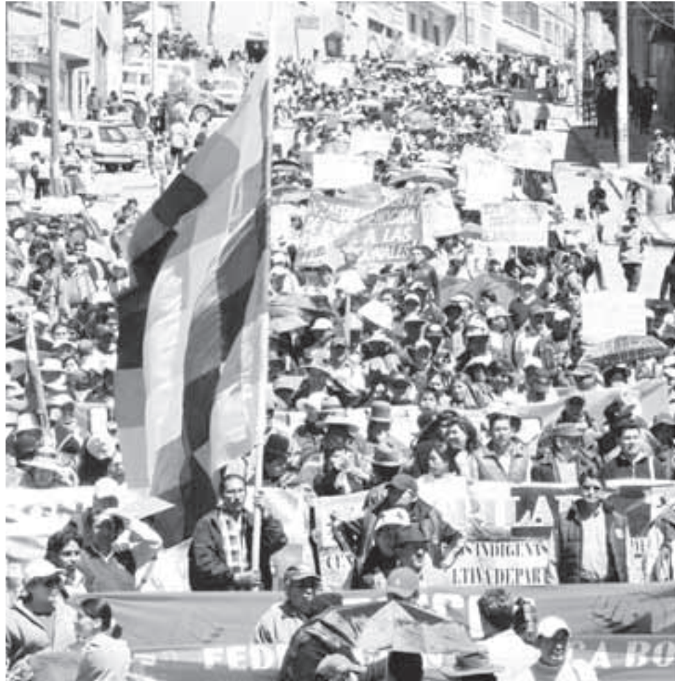
Aspecto de las movilizaciones sociales contra medidas del Gobierno de Evo Morales

La gravedad de los hechos ha llevado a diversos observadores de la situación en Bolivia a hacer toda suerte de reflexiones. En primer lugar se preguntan si la Central Obrera Boliviana, que dice encarnar los intereses de la clase obrera, tenía necesidad de decretar una huelga general, antes que buscar un diálogo con un gobierno interesado en impulsar reformas sociales avanzadas.