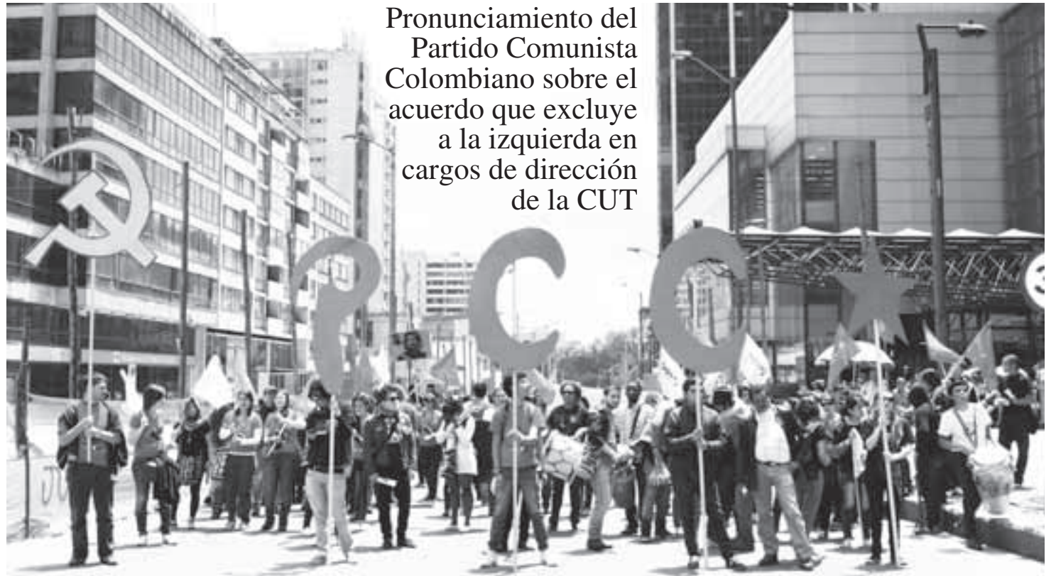
Pronunciamiento del Partido Comunista Colombiano sobre el acuerdo que excluye a la izquierda en cargos de dirección de la CUT

La crisis del movimiento sindical se manifiesta en una debilidad política e ideológica de pérdida de identidad de clase, lo que ha permitido que algunos miembros en la dirección de la CUT, pongan sus intereses personales por encima de los intereses generales de clase. Esta situación debilita a la organización, facilitando dinámicas de conciliación y concesión a un gobierno que profundiza el modelo de despojo, entrega de la soberanía nacional y el recorte de conquistas históricas de los trabajadores y se apresta en la presente y siguiente