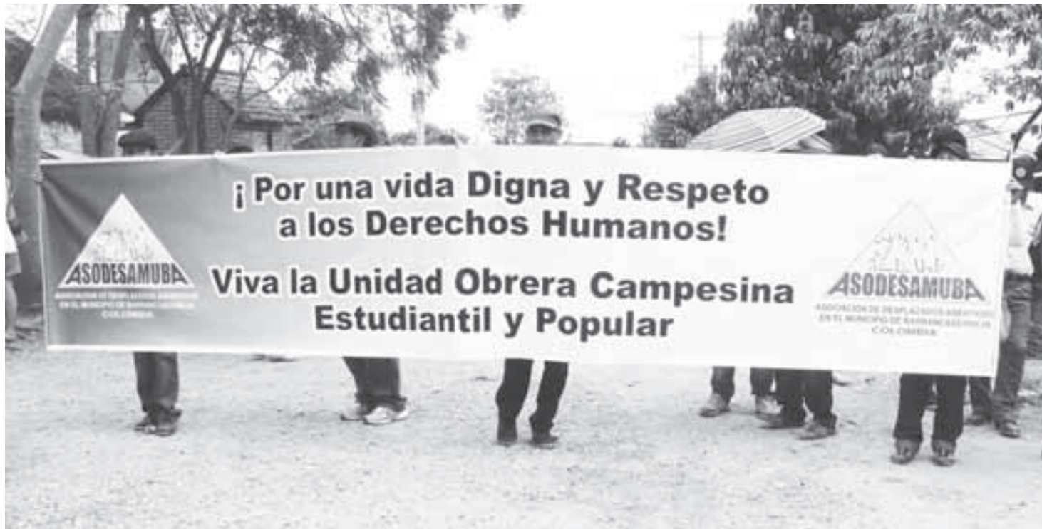
La defensa de los derechos humanos es legítima y es deber del Estado garantizar su ejercicio.