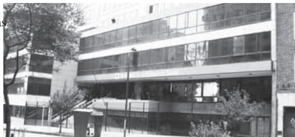
Sede del Ministerio de trabajo, antiguo Ministerio de la Protección Social.

En consecuencia, aceptó la validez de los argumentos de los demandantes y reconoció que dicho artículo nada tenía que ver con el objeto de la ley y que