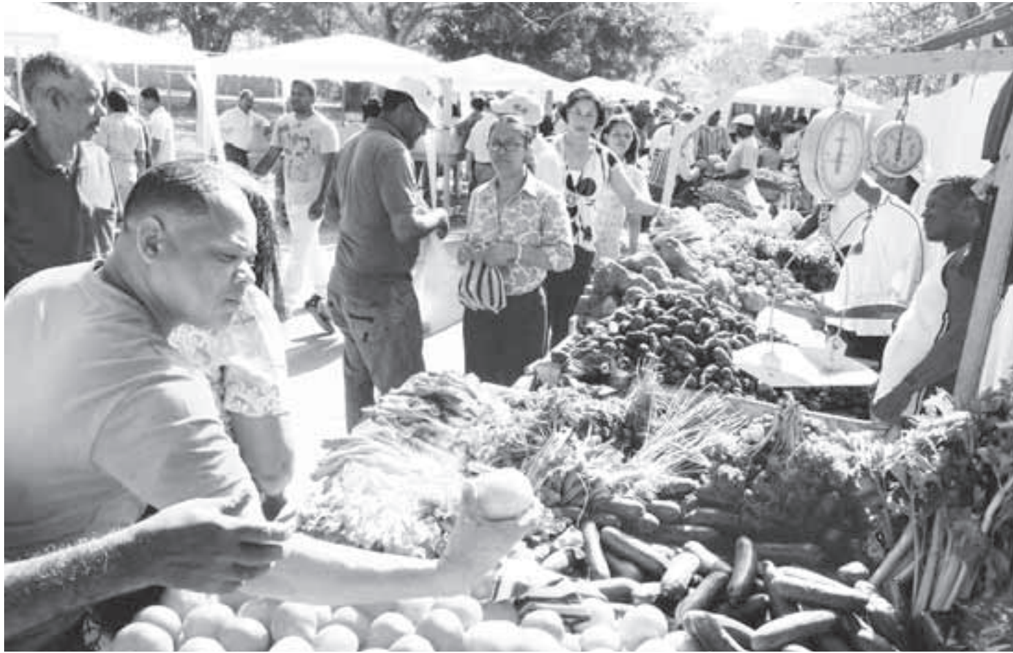
Los productos de la canasta básica que hoy son exentos de gravamen pasarán a tener un IVA del 5% que dice el Ejecutivo será devuelto.